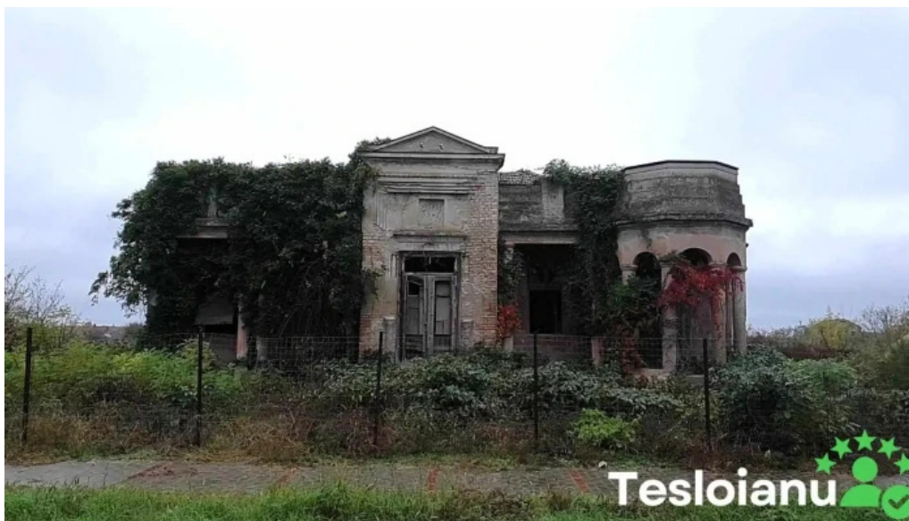
Comuna comlosu mare deschis acum