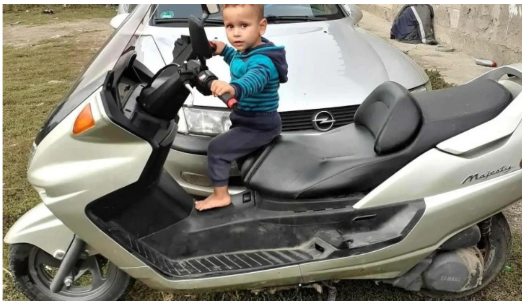
Comuna corbita scor