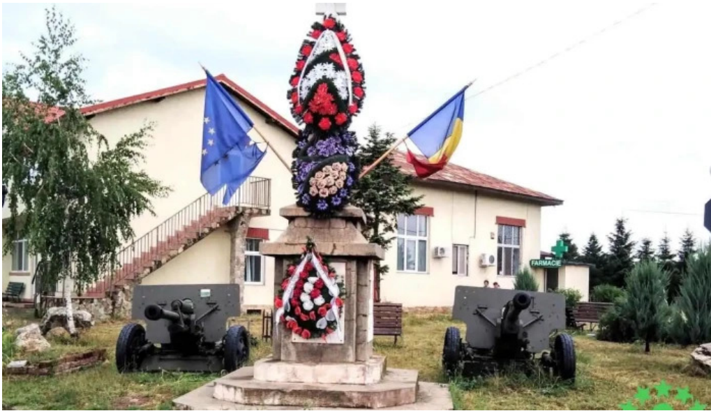
Comuna cosoba romania