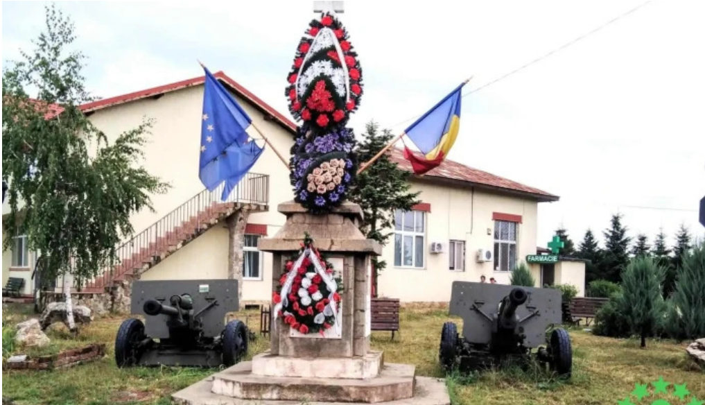
Comuna cosoba cum s? ajungi acolo