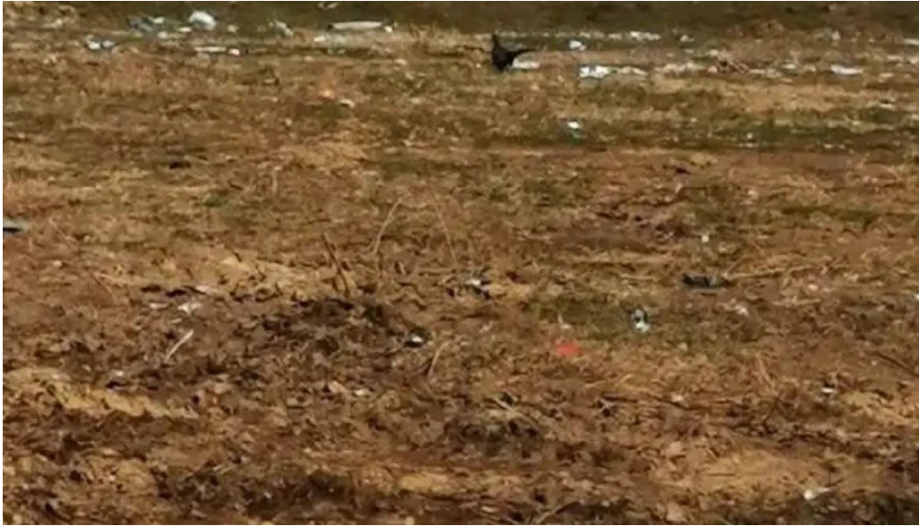
Comuna co?e?ti romania