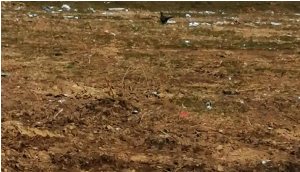
Comuna cosesti reduceri