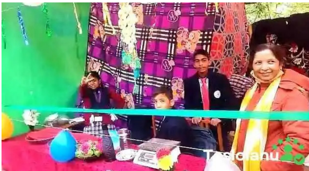
Comuna cosoveni zon?