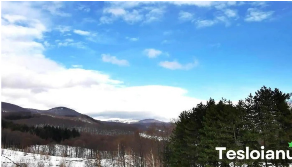
Comuna crasna munte