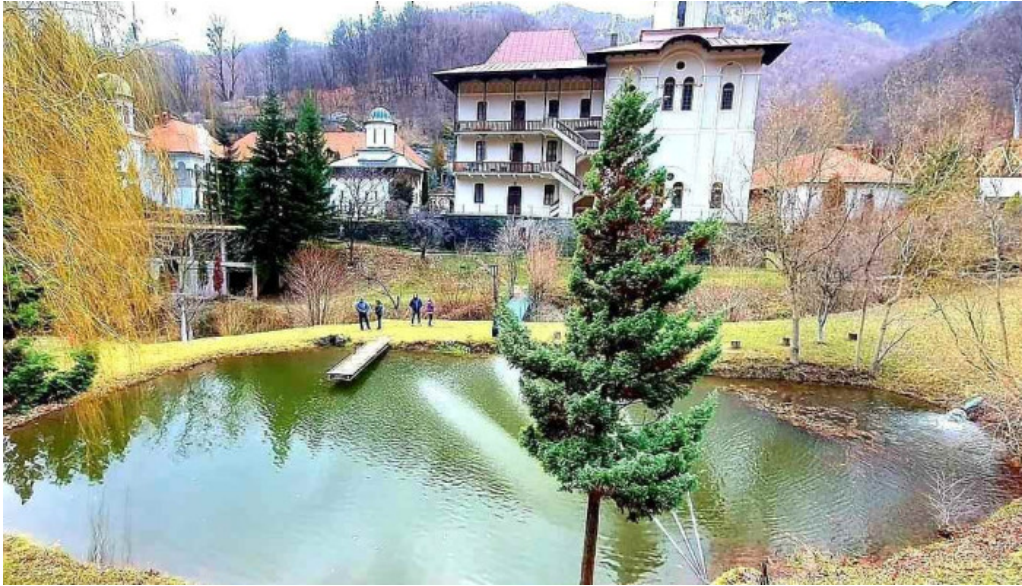
Comuna crasna romania