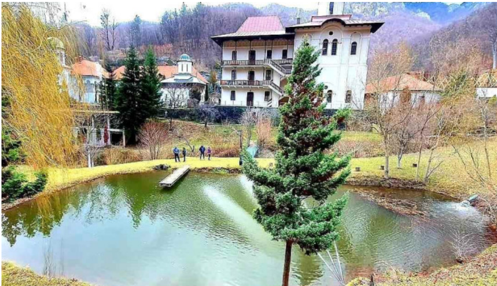
Comuna crasna num?r