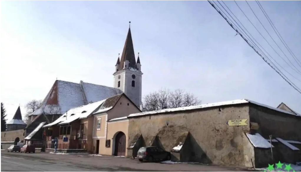
Comuna cristian romania