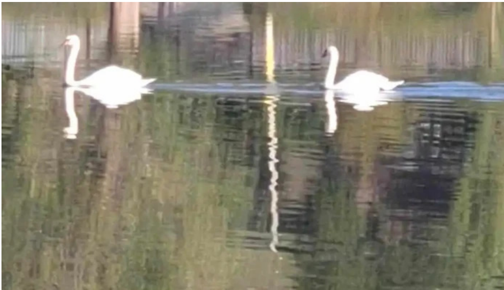
Comuna dumesti videoclipuri