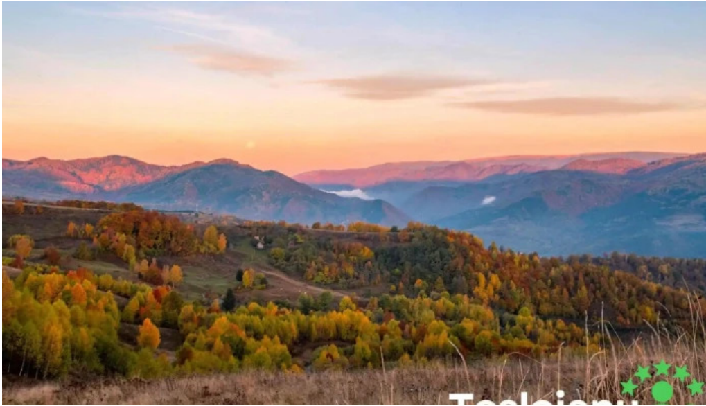
Comuna dumesti zon?