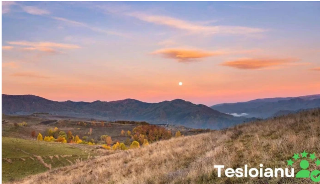
Comuna dumesti munte