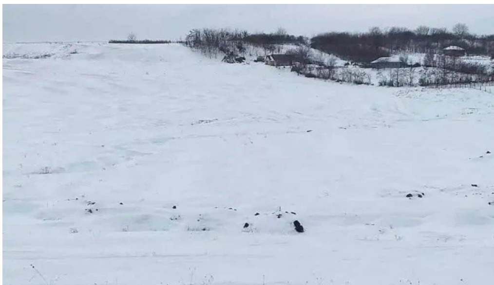
Comuna durnesti deschis acum