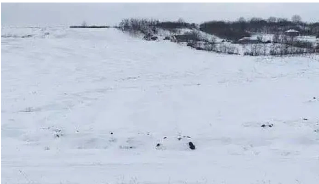
Comuna durnești romania