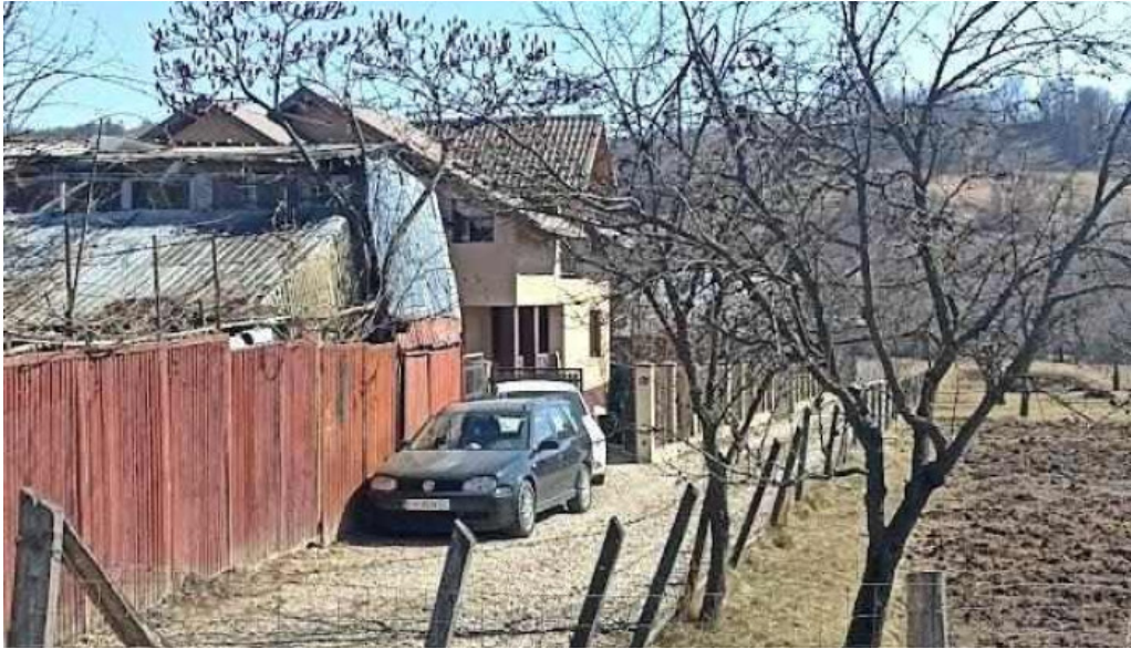
Comuna pose?ti romania