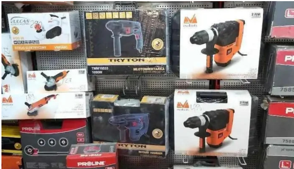
Comuna p?str?veni romania