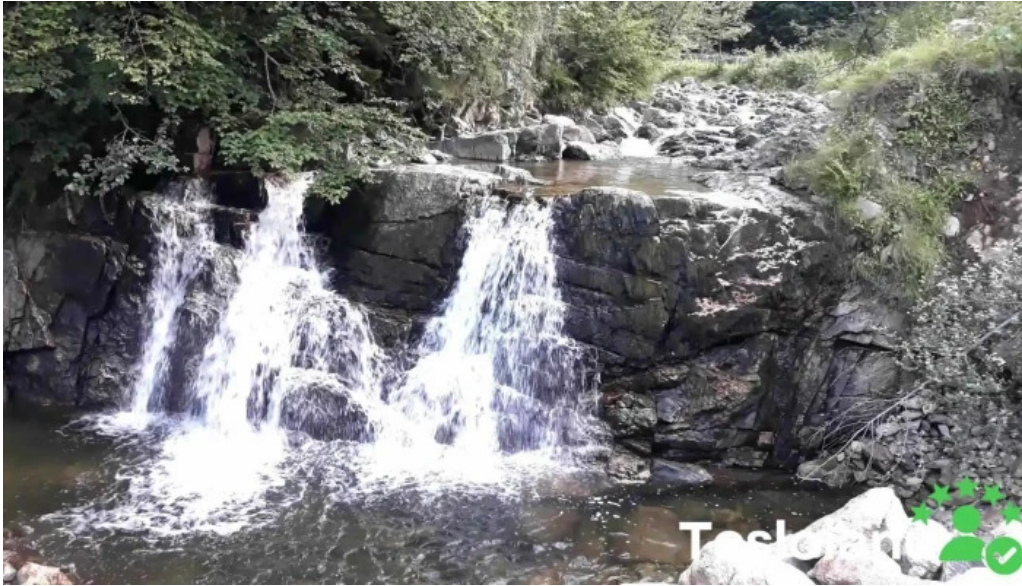
Comuna rau sadului videoclipuri