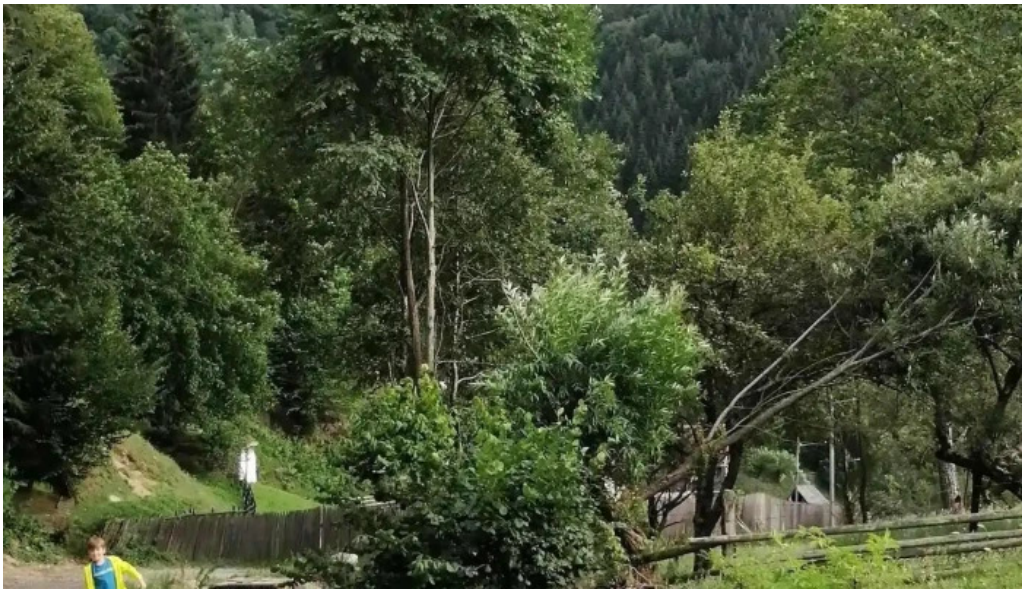
Comuna rau sadului unde