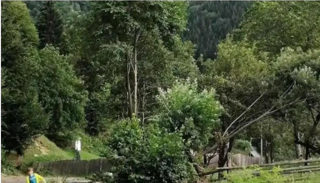
Comuna rau sadului romania