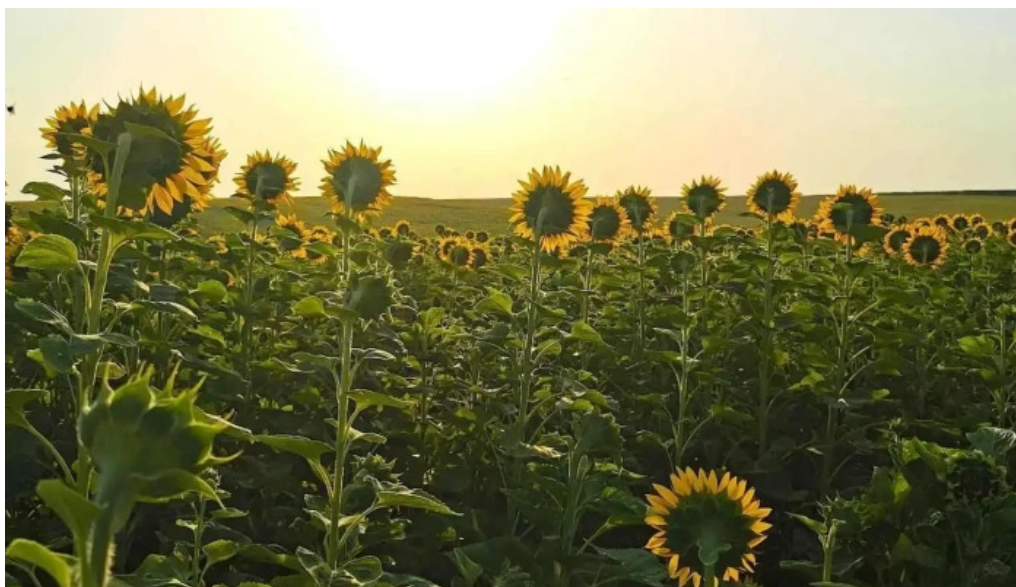
Comuna reuiu catalog