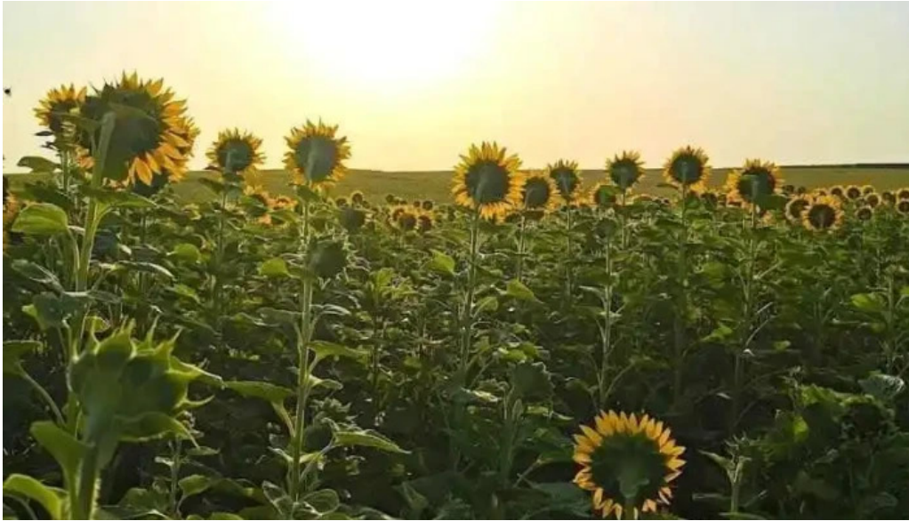
Comuna rediu romania