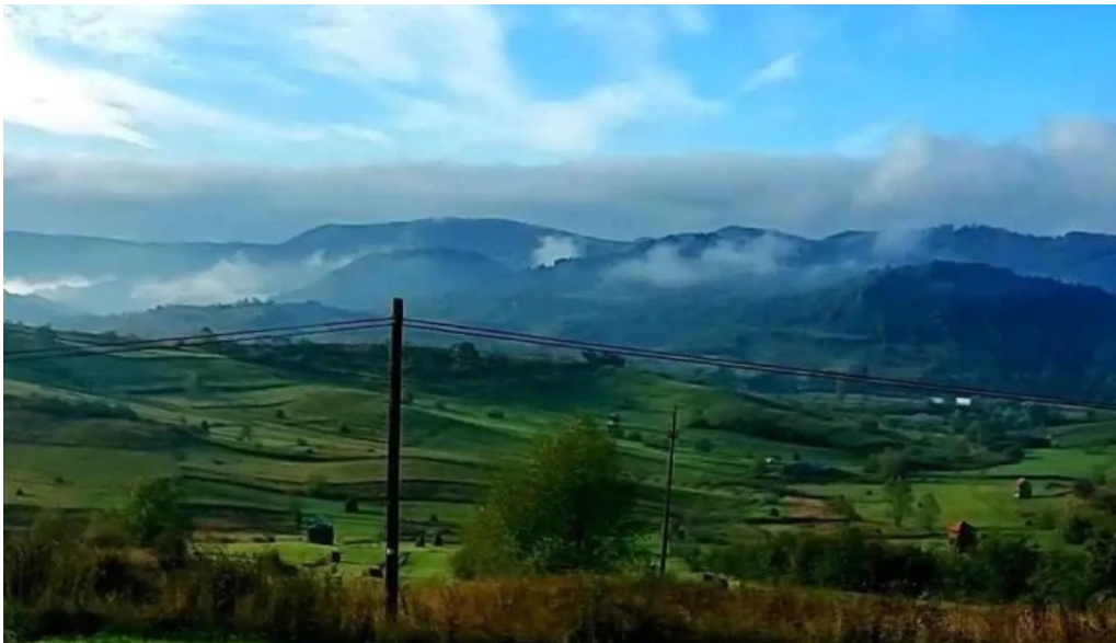
Comuna rona de jos videoclipuri