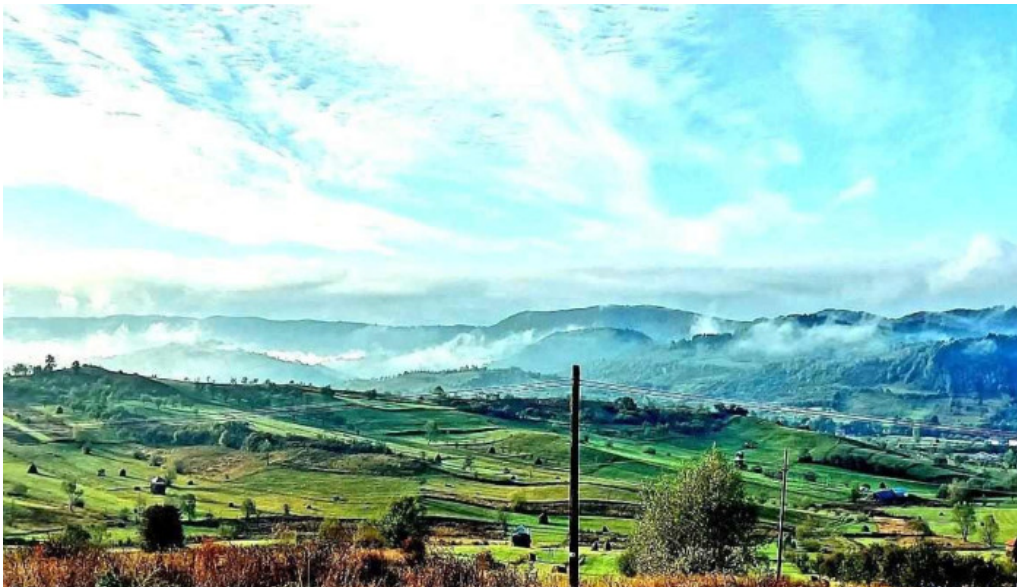
Comuna rona de jos adres?