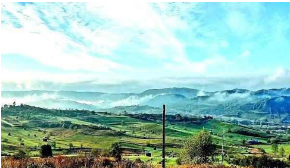
Comuna rona de jos romania