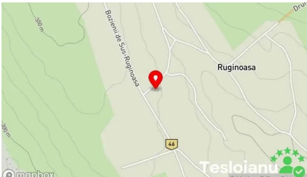
Comuna ruginoasa hart?