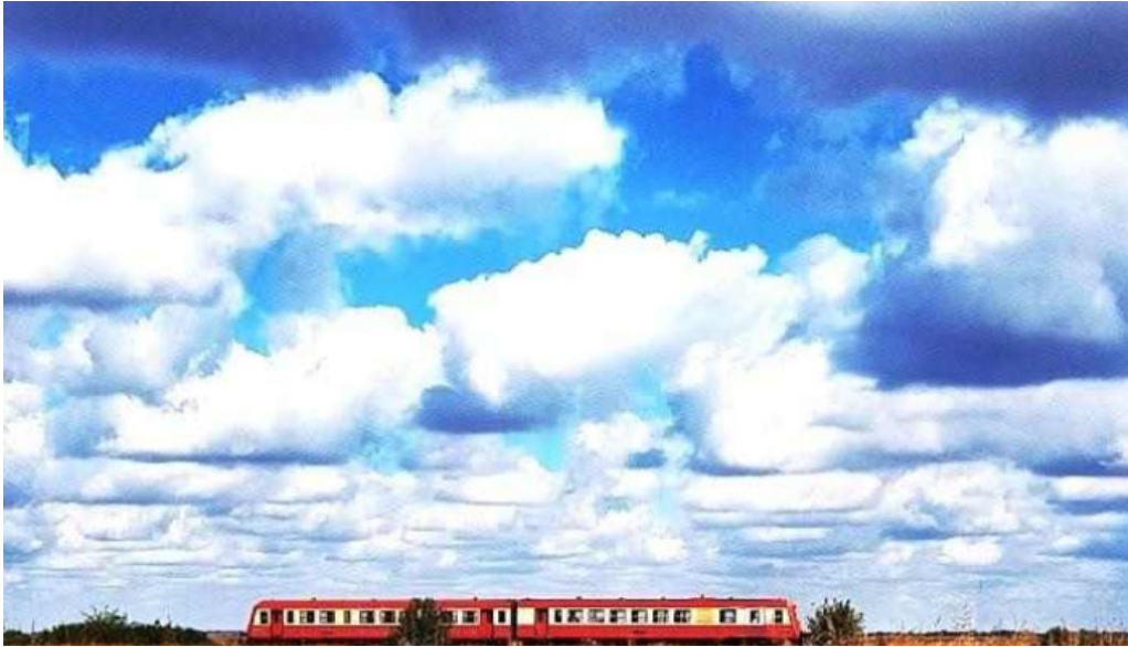
Comuna sanpetru mare romania