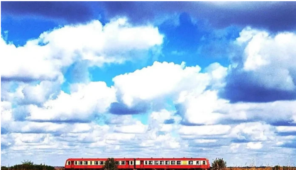
Comuna sanpetru mare promo?ie