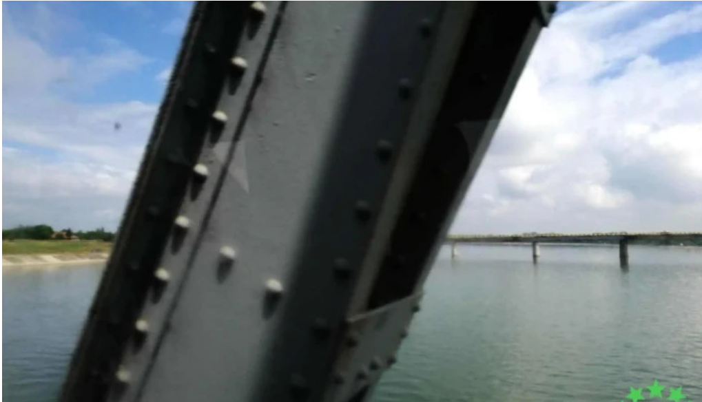
Comuna stoenesti mare