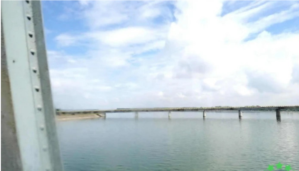
Comuna stoenesti zon?