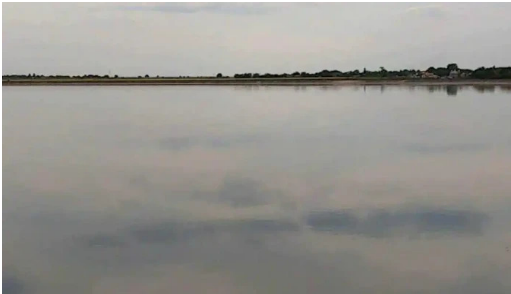
Comuna stoenesti videoclipuri