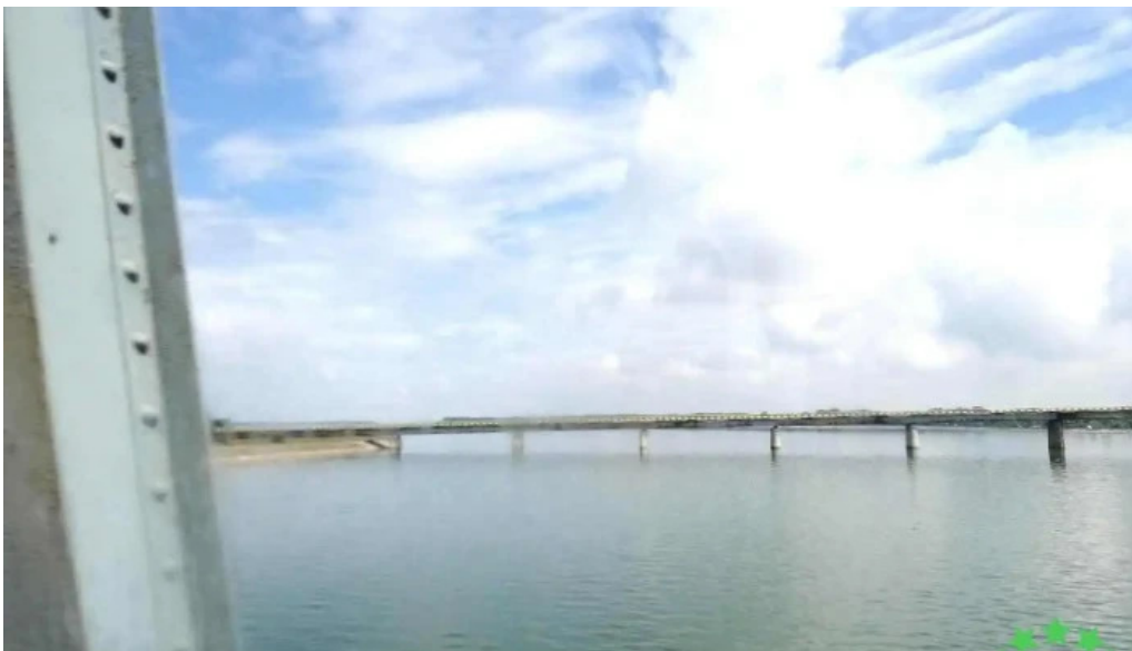
Comuna stoene?ti romania