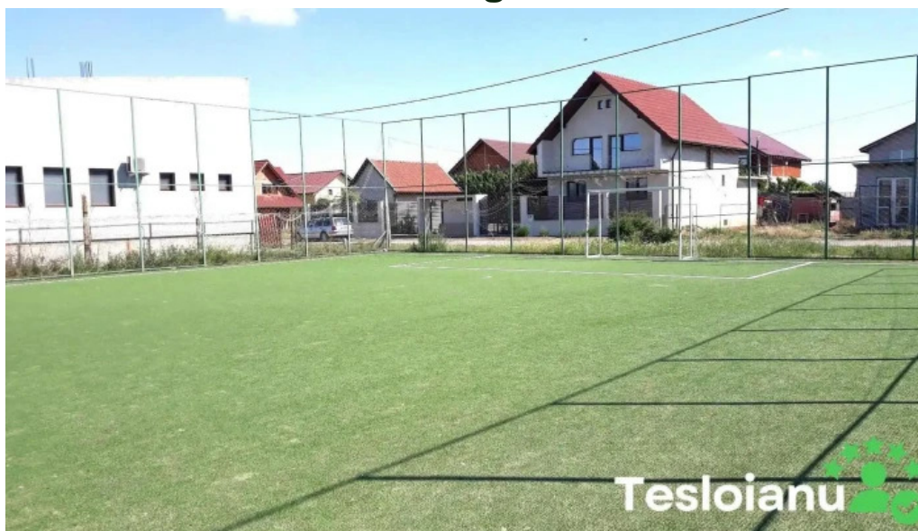
Comuna zimandu nou romania