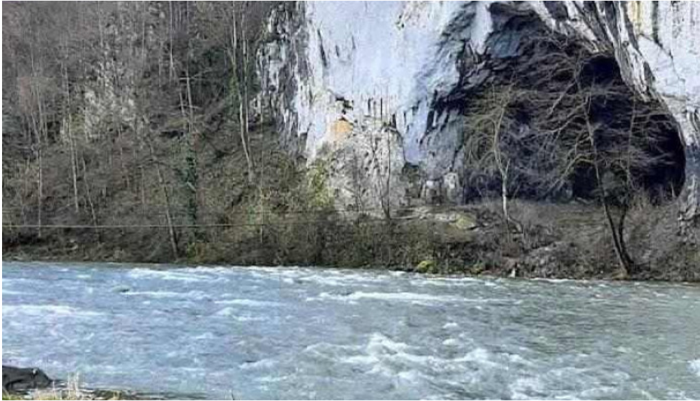
Comuna ?uncuiu? romania