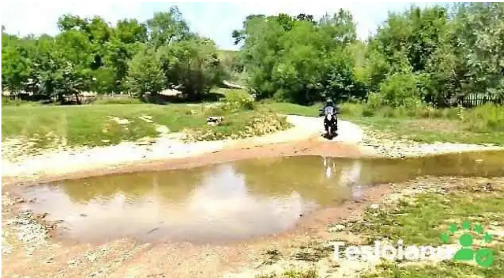
Comuna suncuius videoclipuri