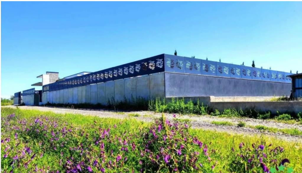
Comuna bolintin deal pre?uri