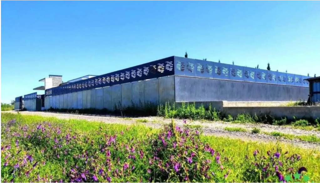
Comun? bolintin deal romania