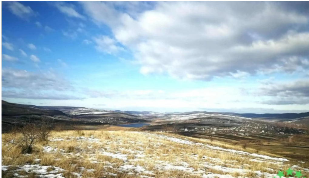
Comuna bunesti averesti pre?uri