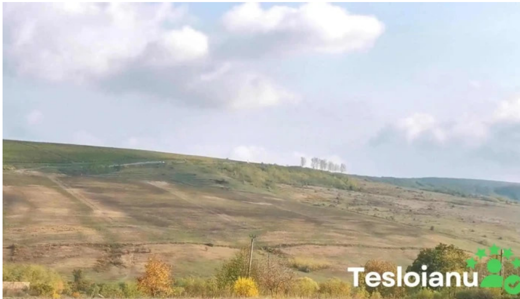
Comuna bunesti averesti videoclipuri