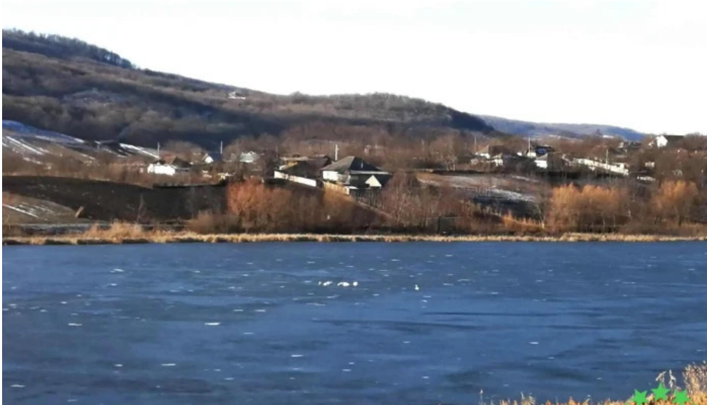
Comuna bunesti averesti munte