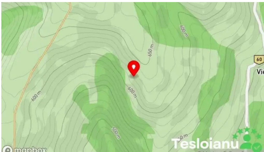
Comuna ceru bacainti hart?