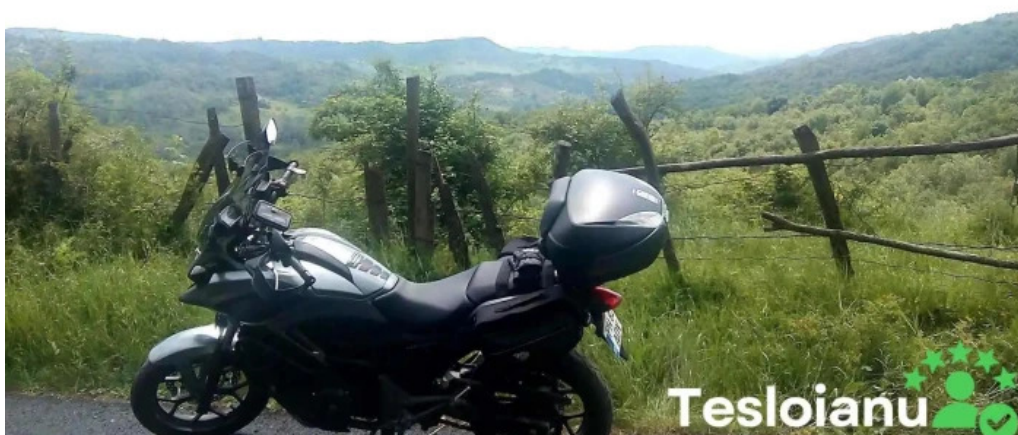
Comun? predeal s?rari romania