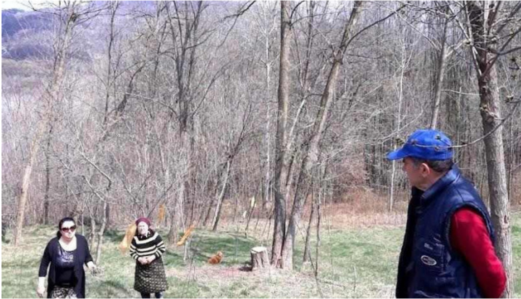
Comun? p?use?ti m?gla?i romania