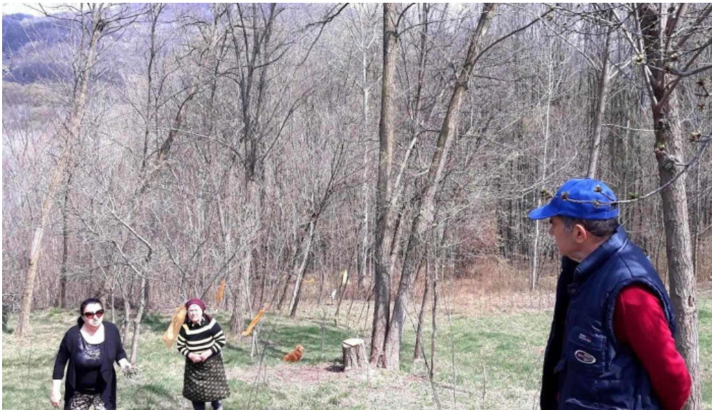
Comuna pausesti maglasi site web