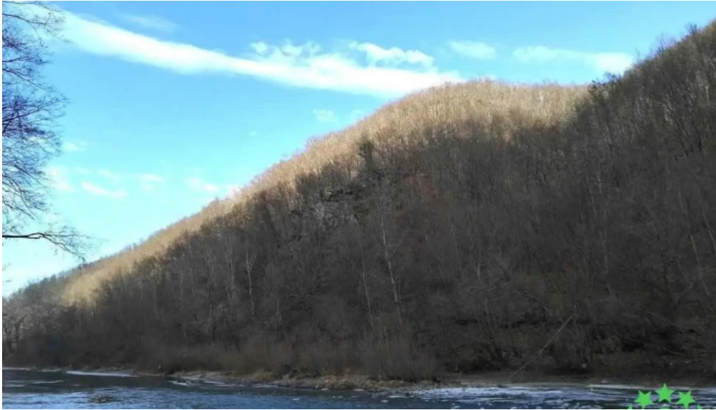
Comun? remetea chioarului romania