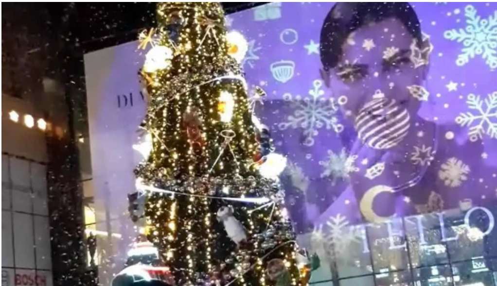
Comuna remetea chioarului videoclipuri