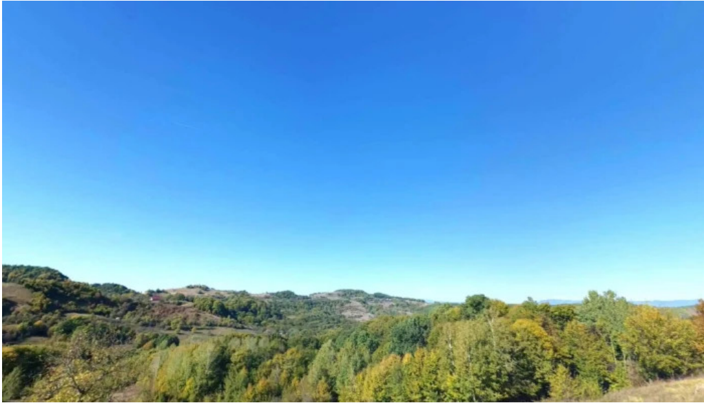
Comuna remetea chioarului street view si 360deg