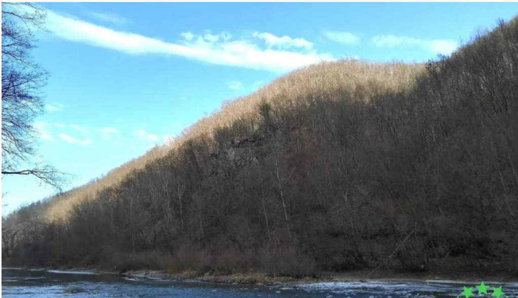
Comuna remetea chioarului instagram