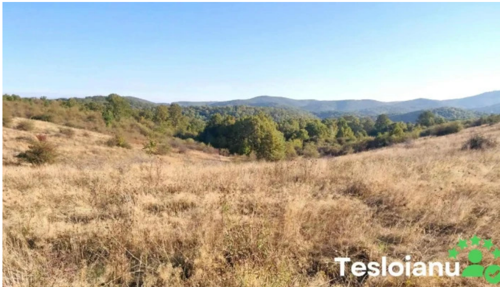
Oras bocsa munte