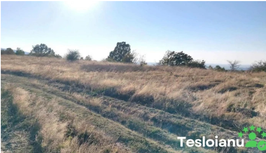
Ora? boc?a romania