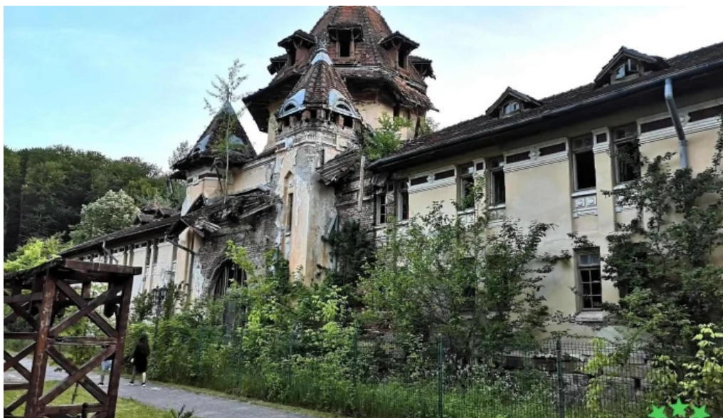
Orasul baile govora fotografii