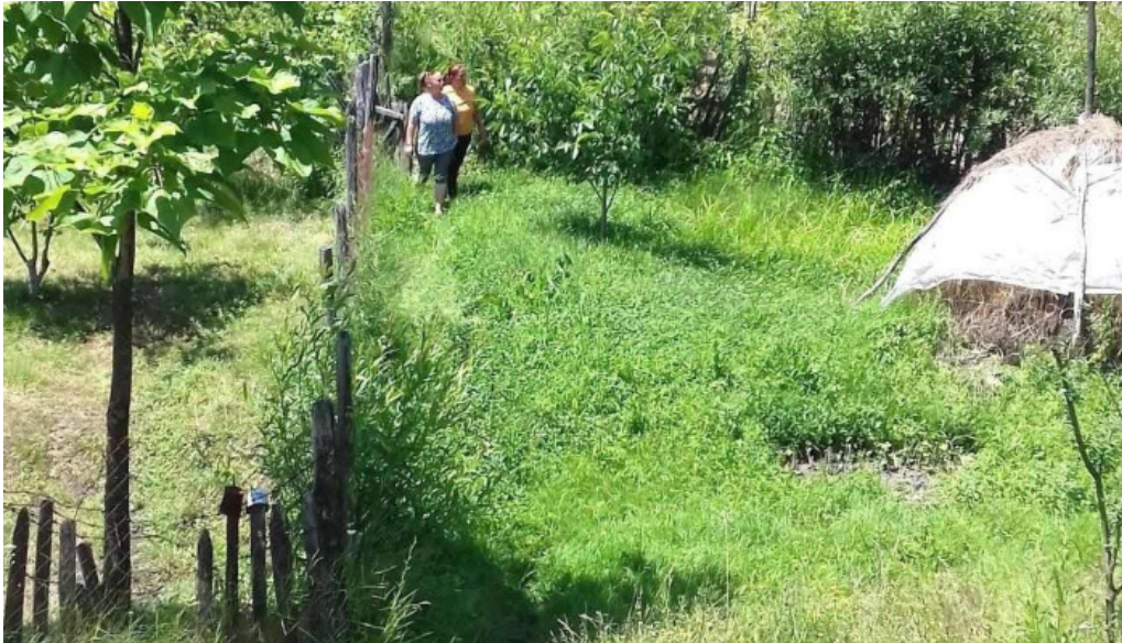
Rosia de amaradia zon?