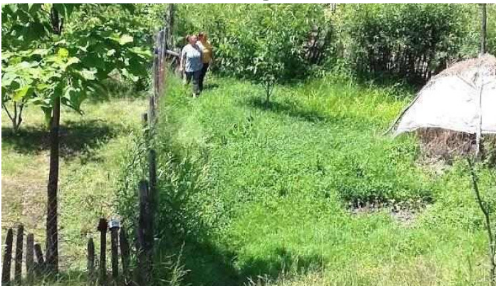
Ro?ia de amaradia ro?ia de amaradia