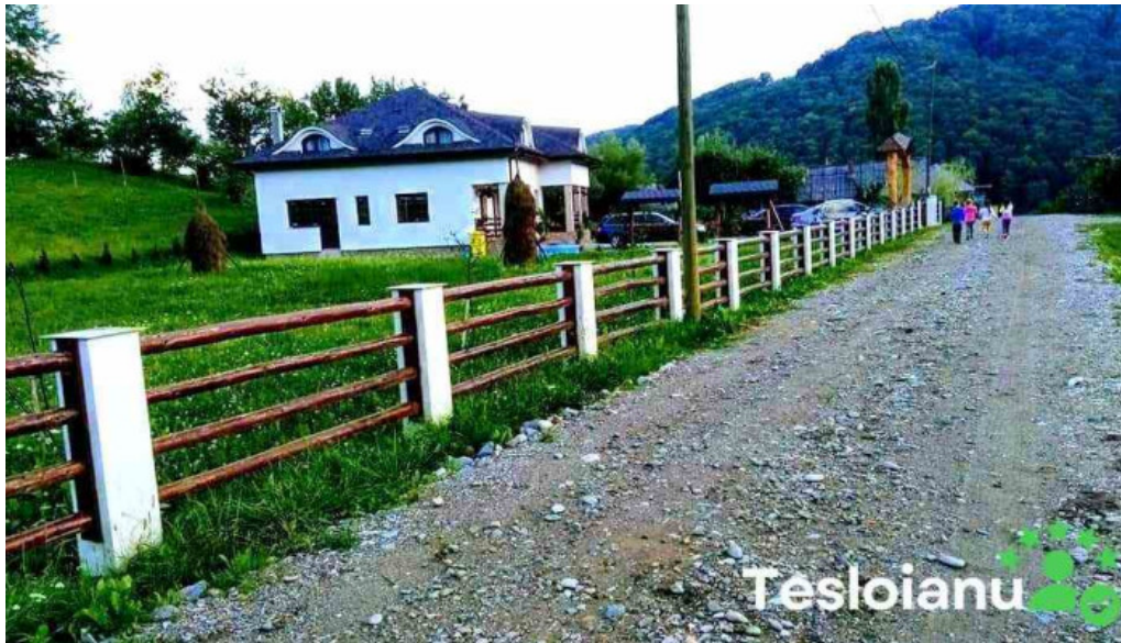
Runcu salvei recenzii