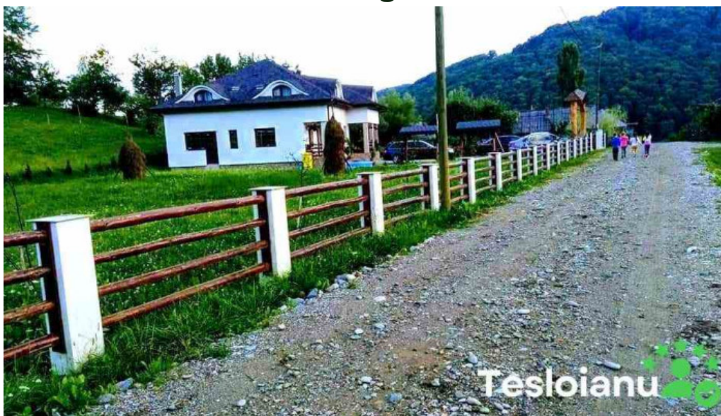
Runcu salvei runcu salvei