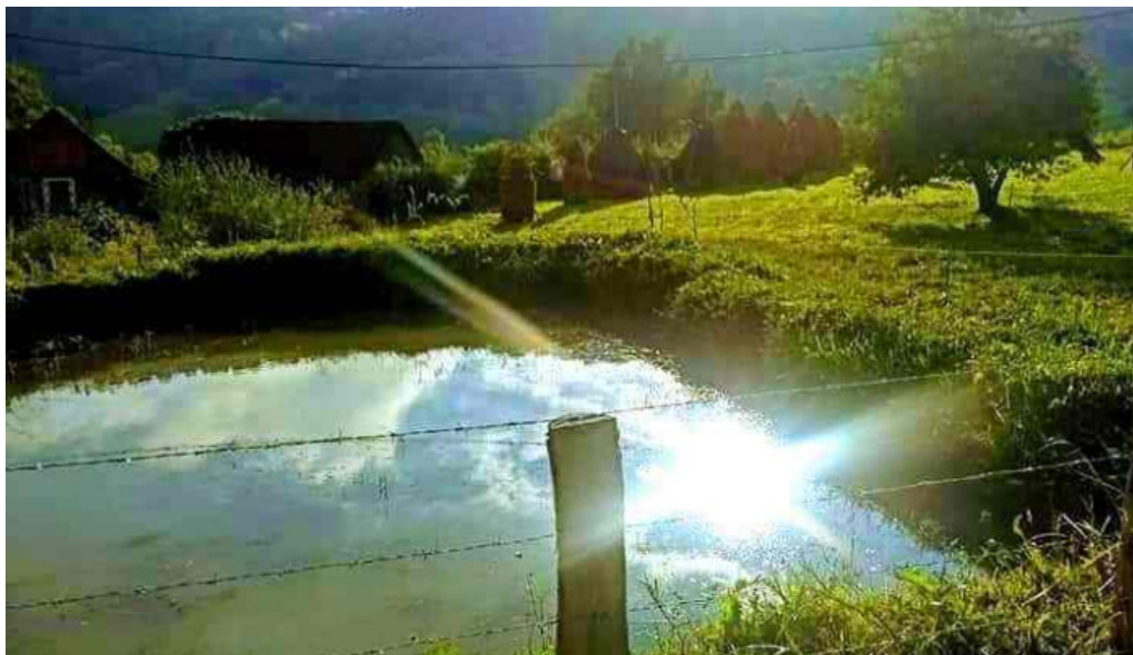
Runcu salvei munte