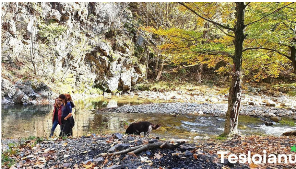
Runcu deschis acum