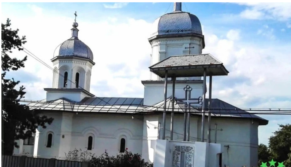
Rastoaca aproape de mine