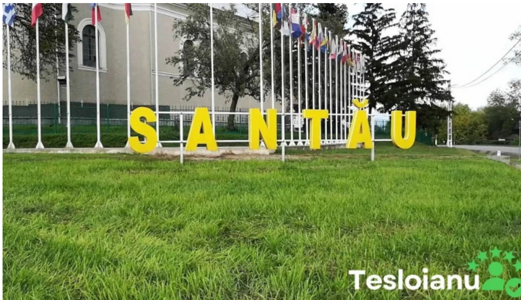
Santau aproape de mine