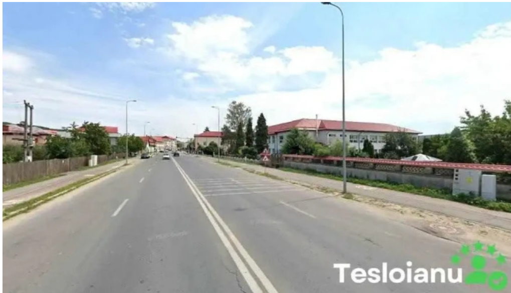
Muncitoarea s c m topoloveni