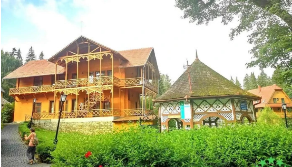
Ora?ul borsec vacio