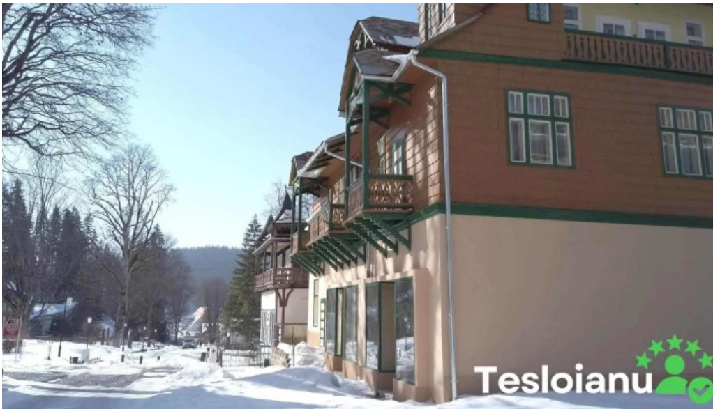
Orasul borsec videoclipuri