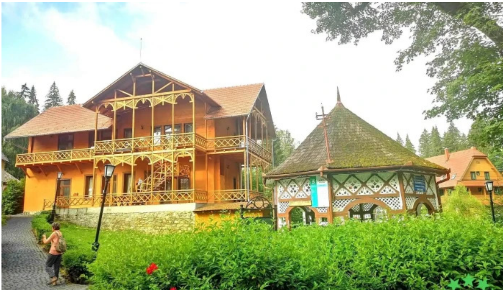
Orasul borsec reduceri