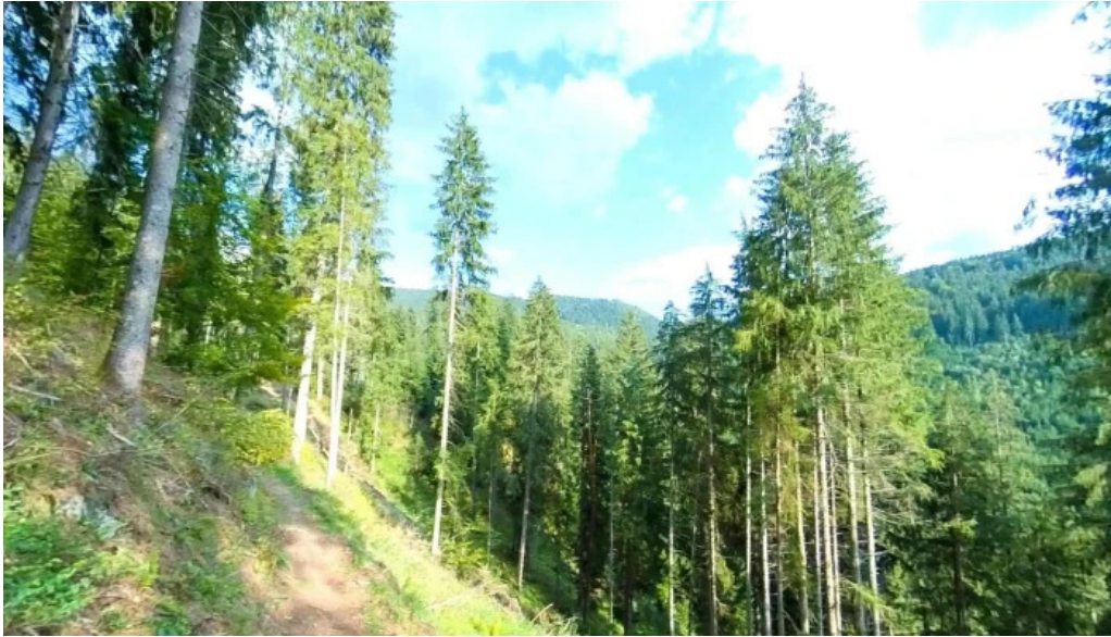
Orasul borsec street view si 360deg