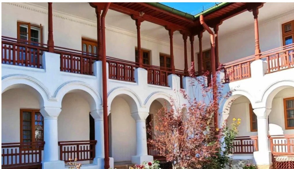
Manastirea agapia adres?