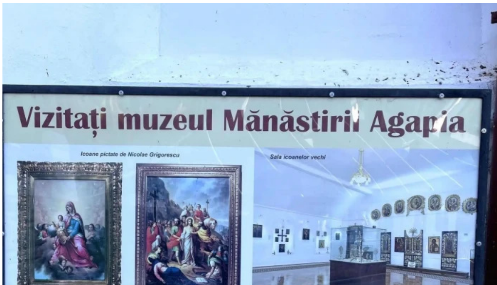
Manastirea agapia agapia