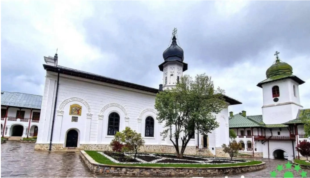
Manastirea agapia agapia