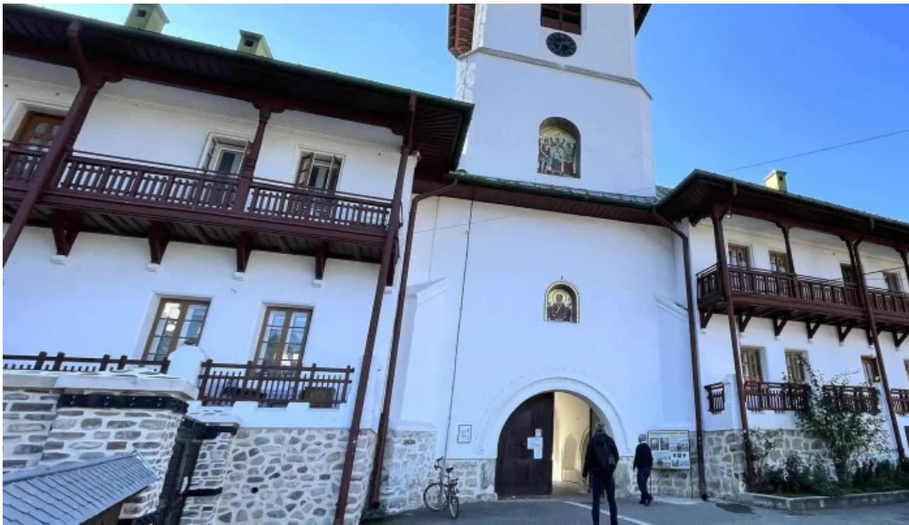
Manastirea agapia cum s? ajungi acolo