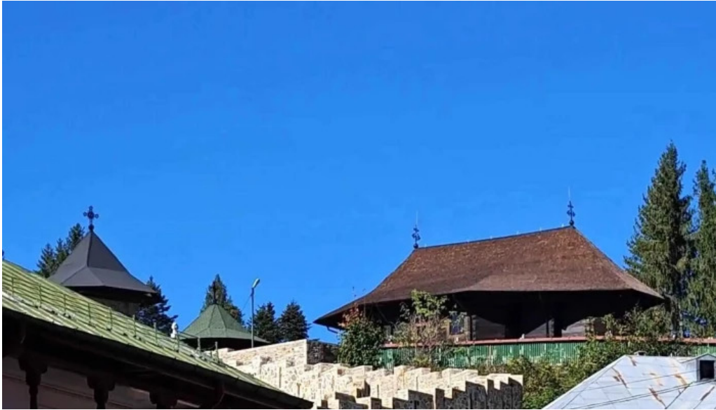
Manastirea agapia unde