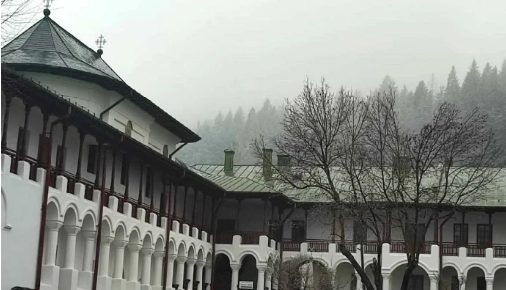
Manastirea agapia program