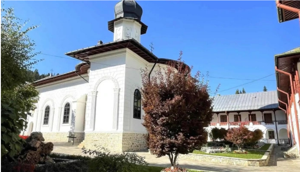
Manastirea agapia comentarii