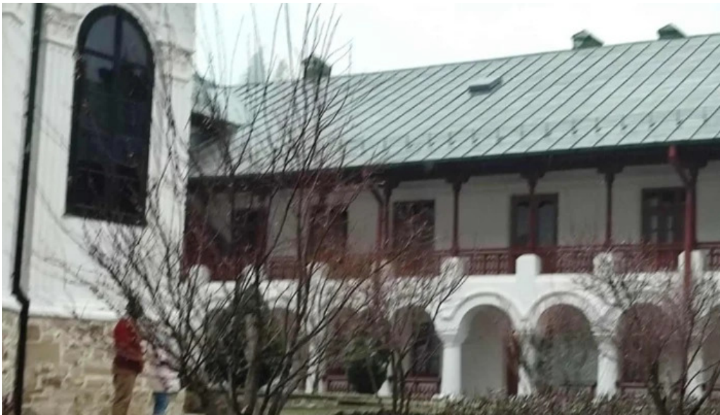
Manastirea agapia videoclipuri