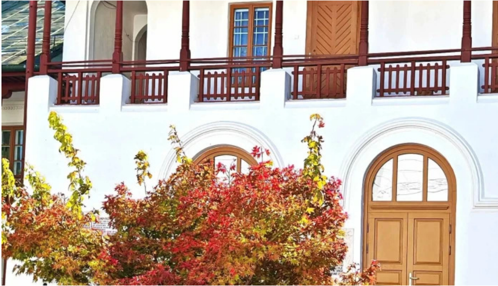
Manastirea agapia scor