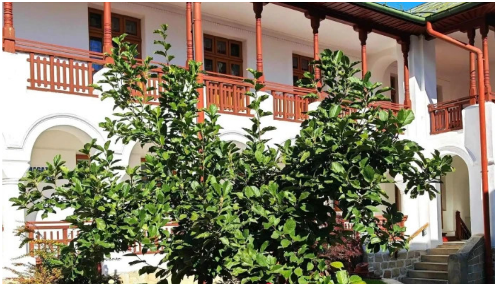
Manastirea agapia aproape de mine