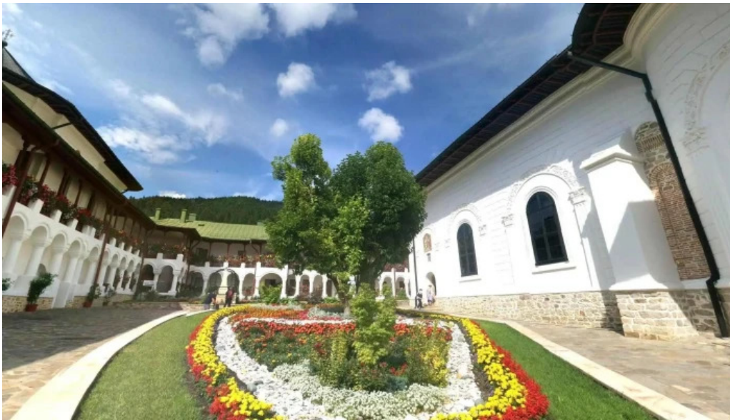
Manastirea agapia street view si 360