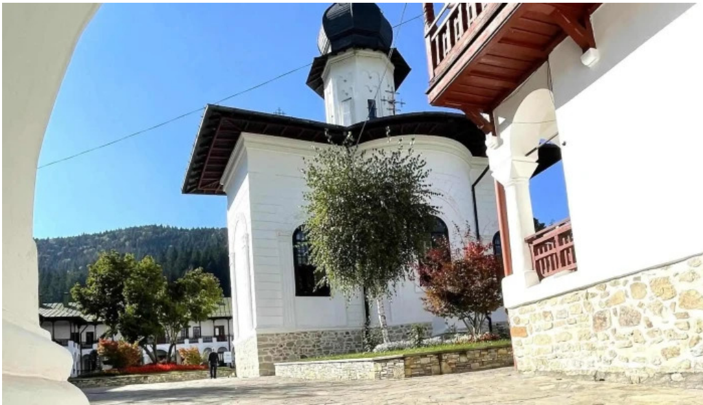
Manastirea agapia reduceri