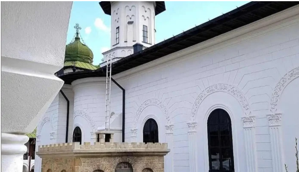
Manastirea agapia cele mai recente