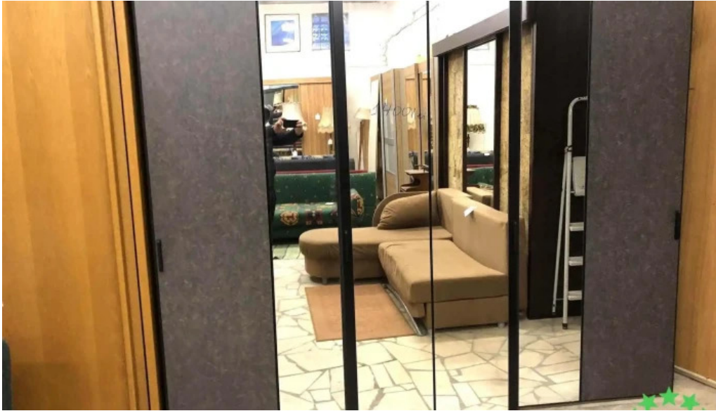
Anturaj mobila sh ungheni recenzii