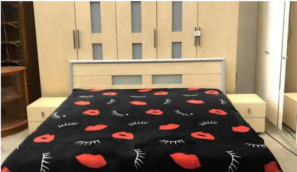
Anturaj mobila sh ungheni interior