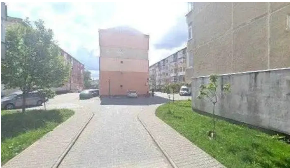
La cabanuta street view si 360