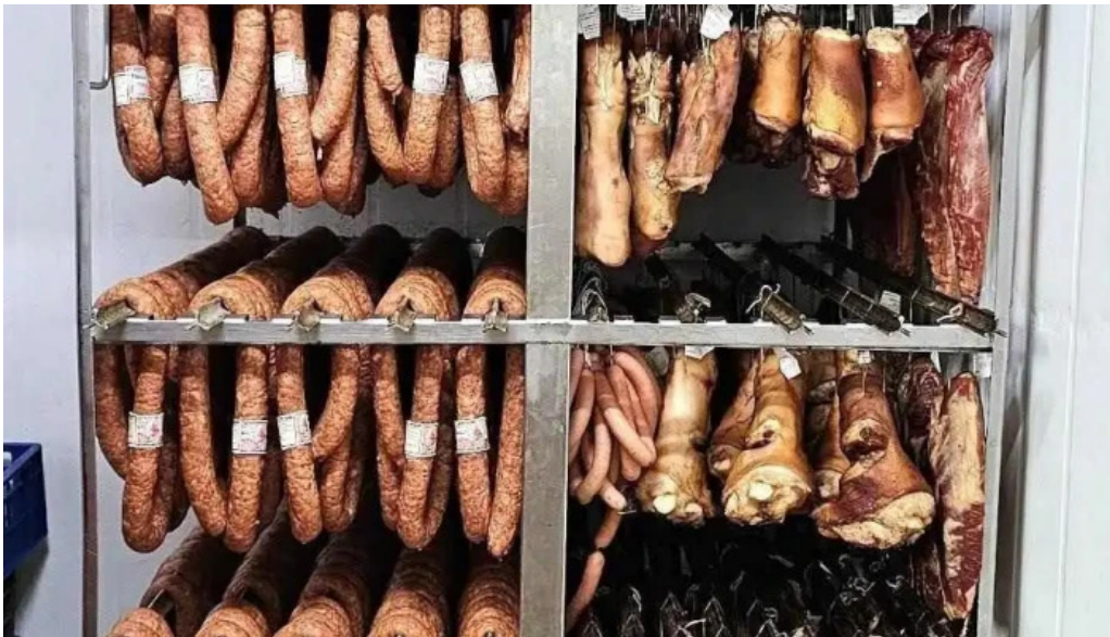
La cabanuta instagram