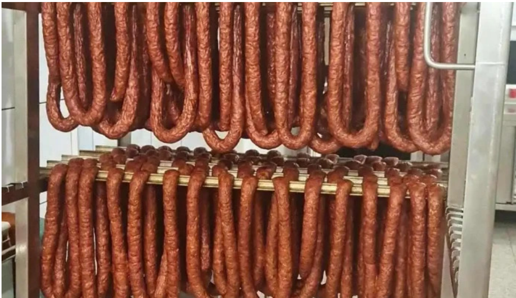
La cabanuta de la proprietar