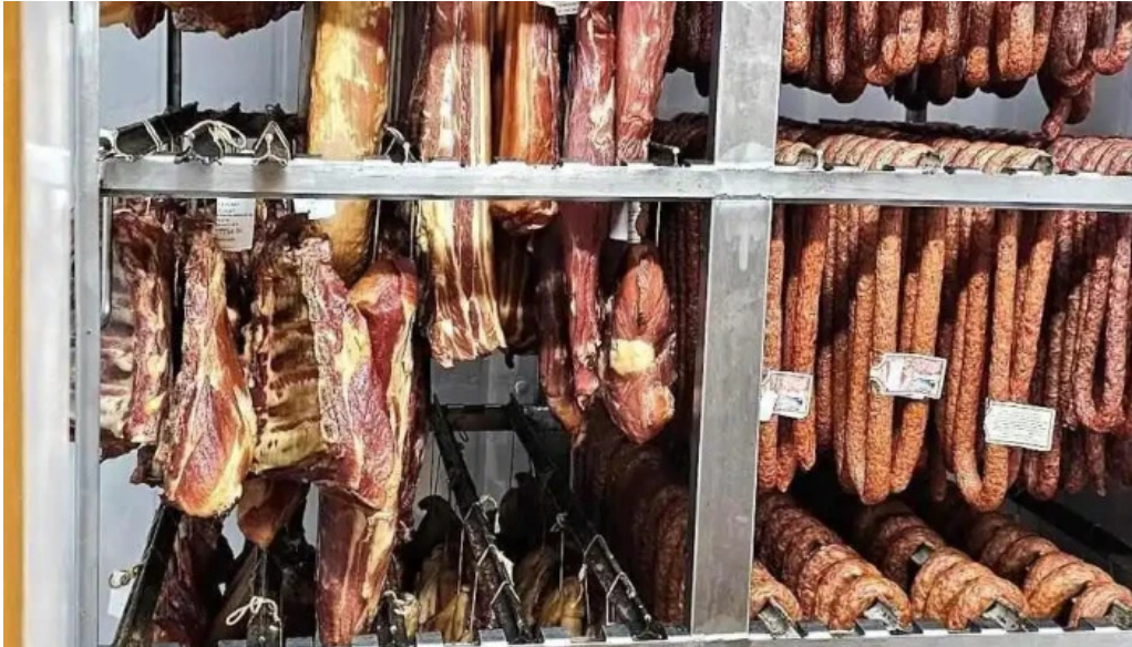
La cabanuta interior