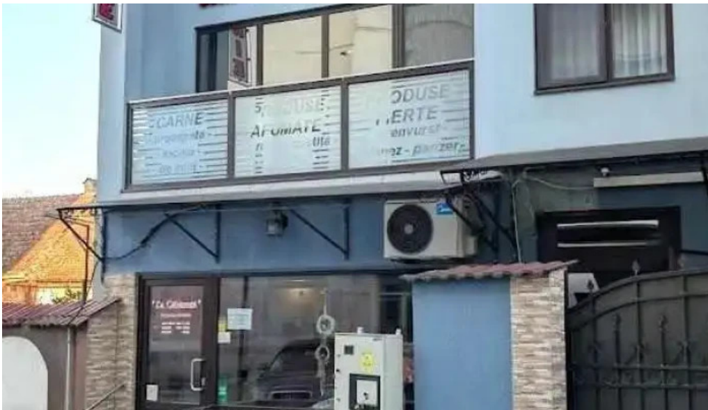
La c?b?nu?? avrig