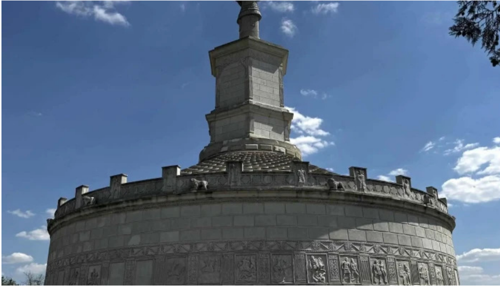
Tropaeum traiani recenzii