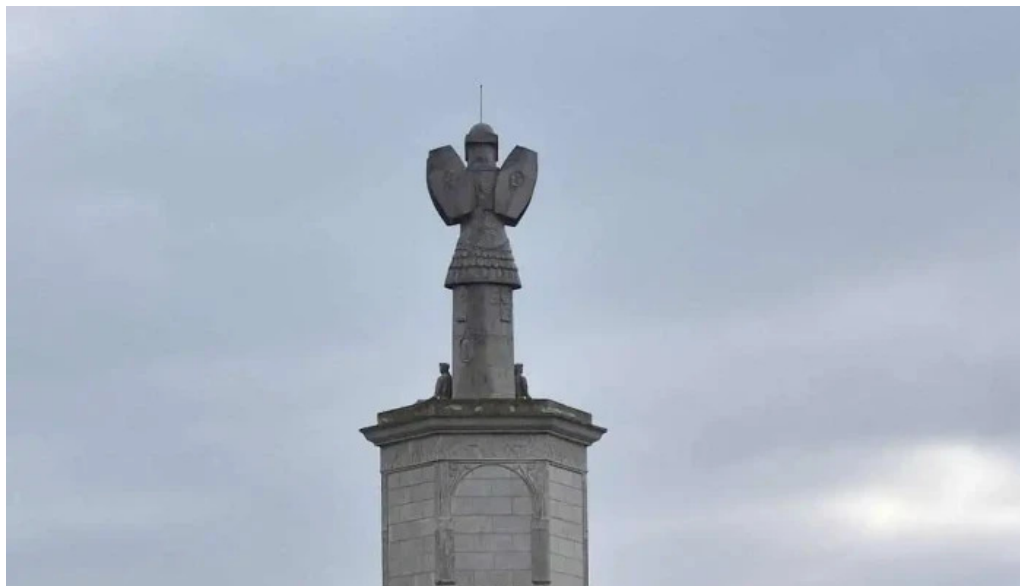
Tropaeum traiani cele mai recente