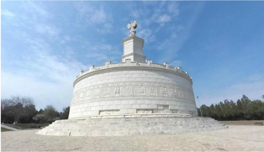
Tropaeum traiani street view si 360