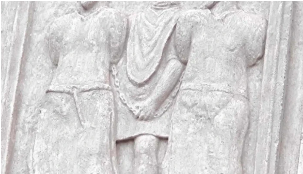
Tropaeum traiani promo?ie