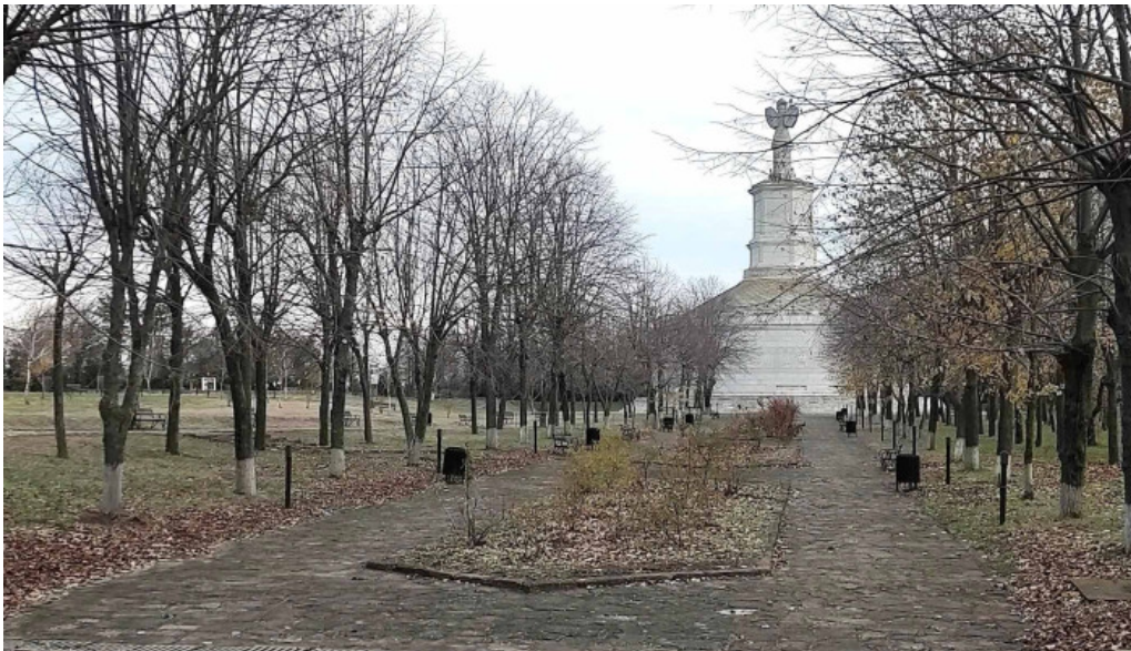
Tropaeum traiani adamclisi