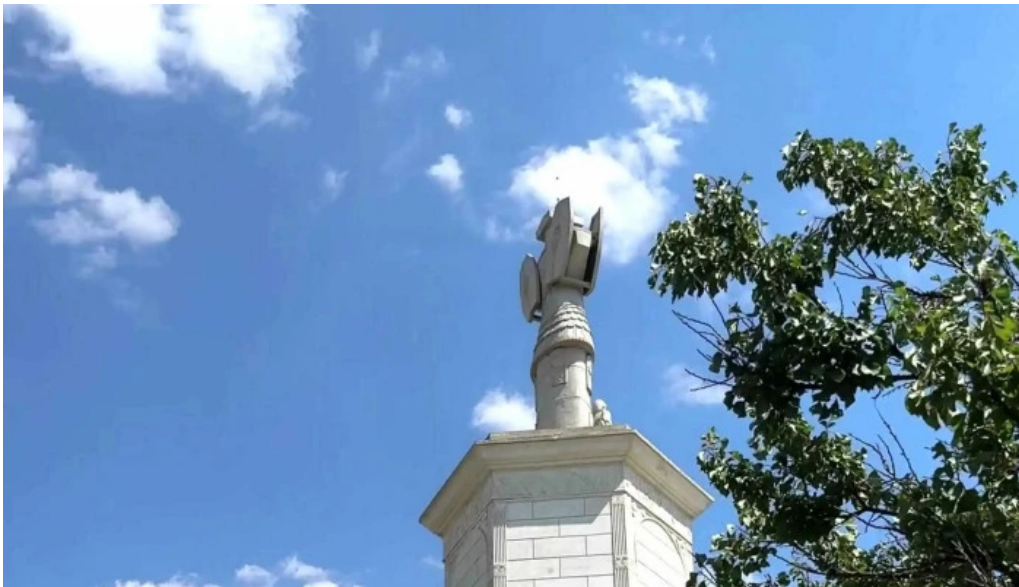
Tropaeum traiani reduceri