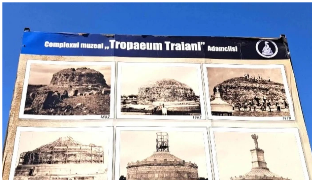
Tropaeum traiani comentarii