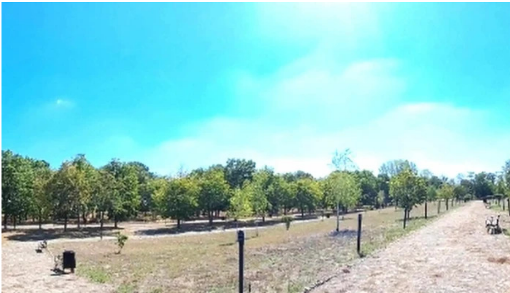
Tropaeum traiani loca?ie