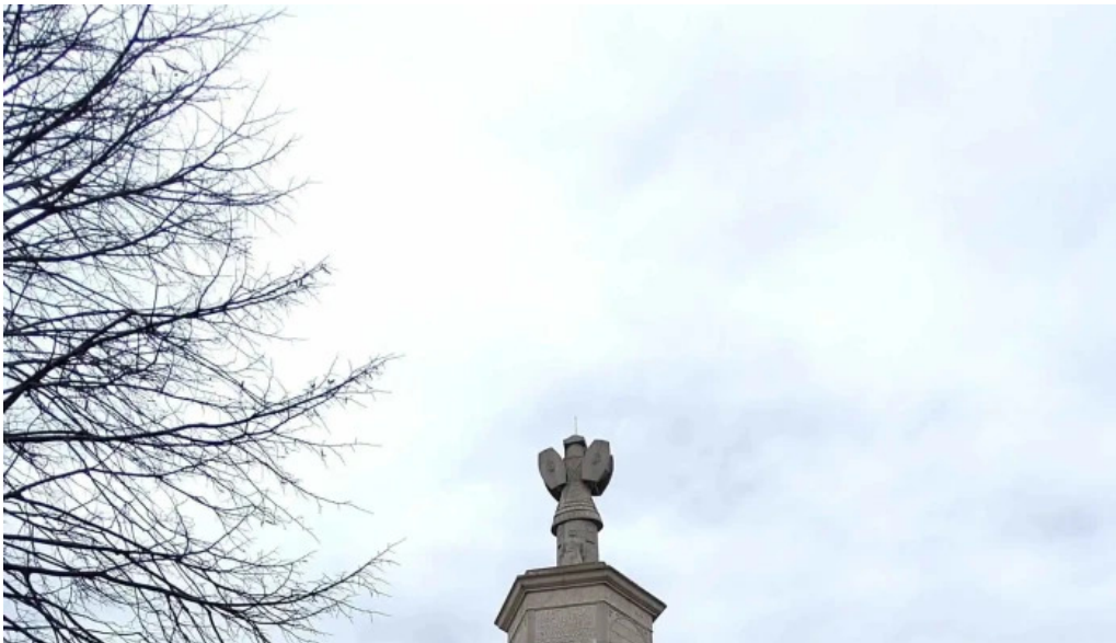
Tropaeum traiani fotografii