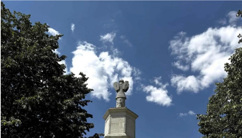
Tropaeum traiani catalog