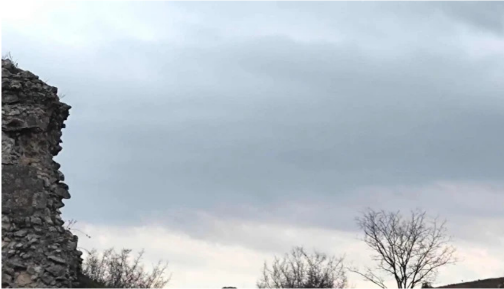
Tropaeum traiani program