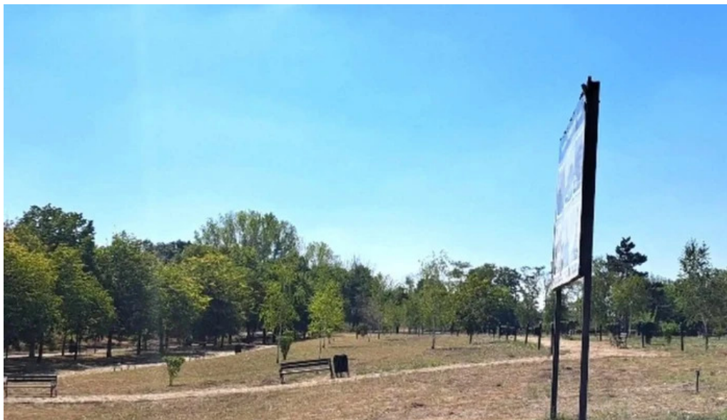
Tropaeum traiani unde