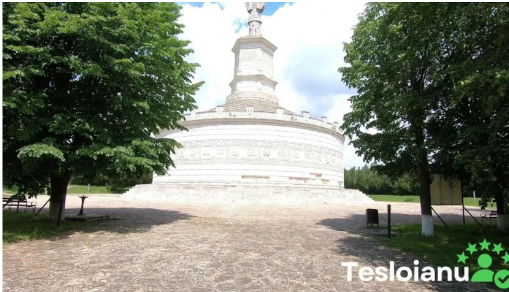
Tropaeum traiani videoclipuri