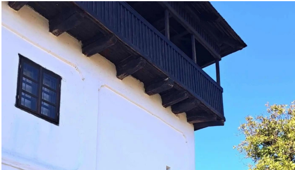
Cula cernateștilor aproape de mine