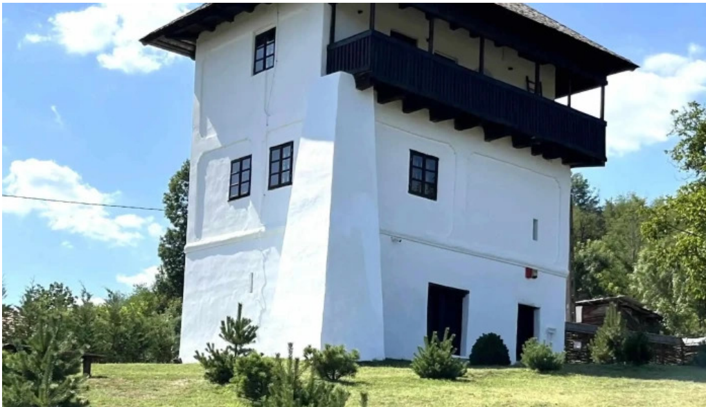
Cula cernatestilor instagram