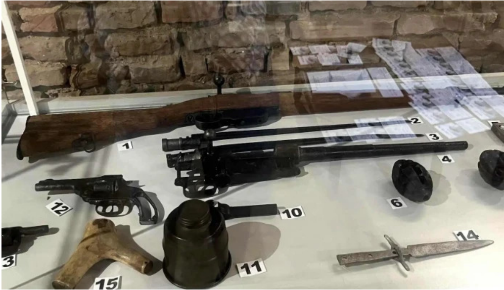
Cula cernatestilor recenzii