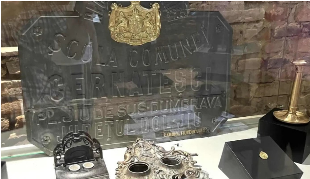
Cula cernatestilor unde