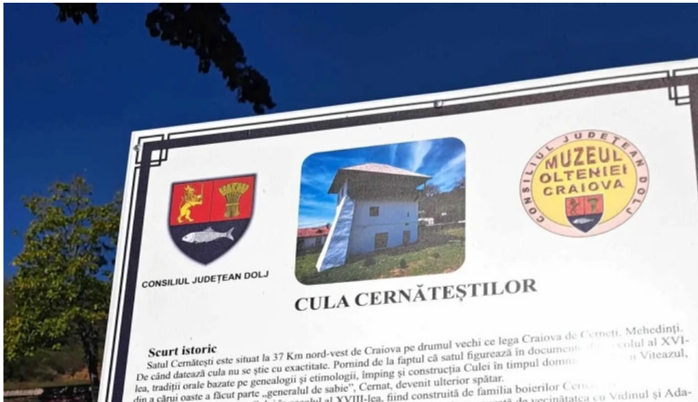
Cula cernateștilor cern?te?ti