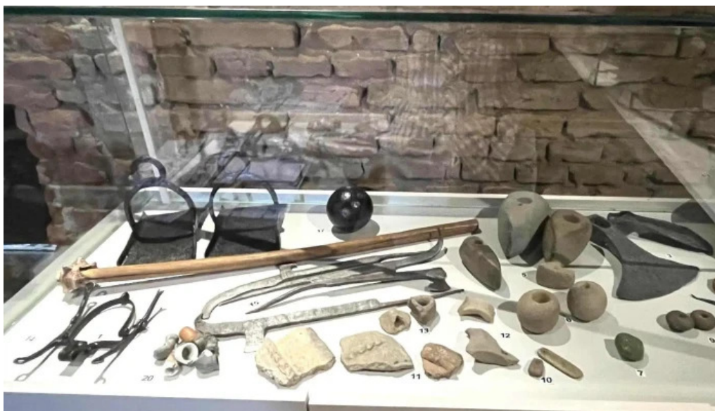
Cula cernateștilor adreș?