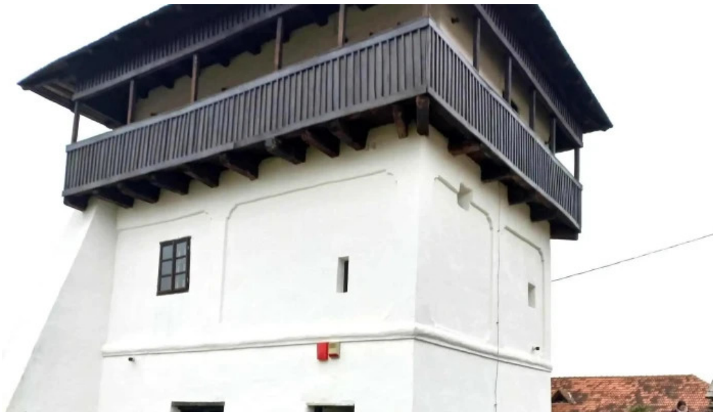
Cula cernateștilor reduceri