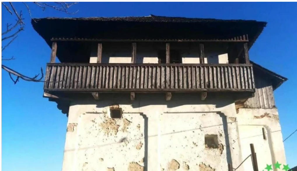
Cula cernăteților cernăteți