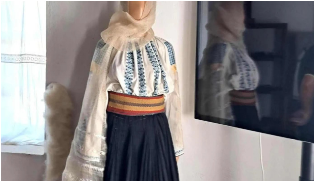
Cula cernateștilor deschis acum