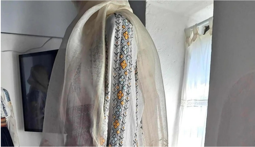
Cula cernatestilor videoclipuri