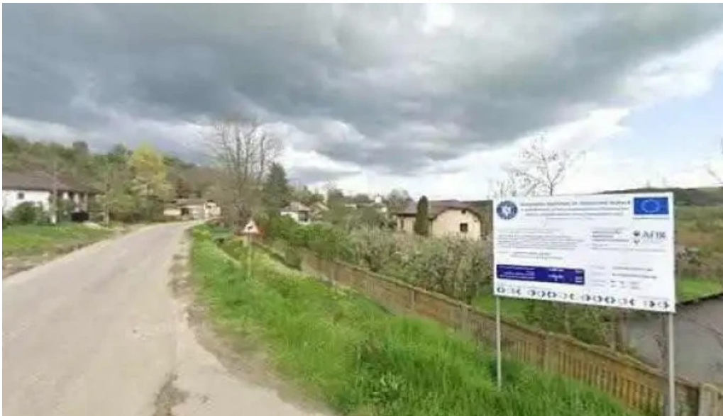
Cula cernateștilor street view si 360deg