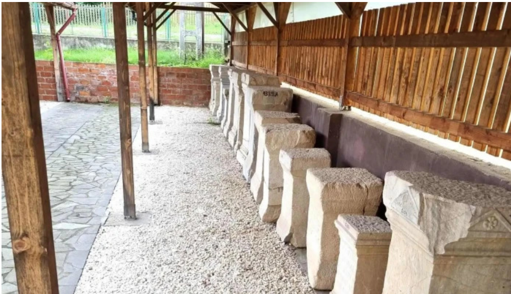
Muzeul de arheologie sarmizegetusa sarmizegetusa