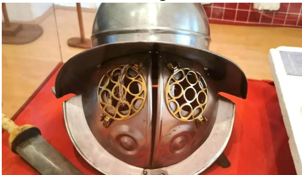
Muzeul de arheologie sarmizegetusa videoclipuri