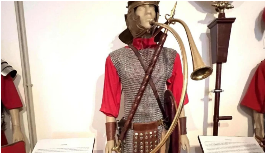
Muzeul de arheologie sarmizegetusa telefon