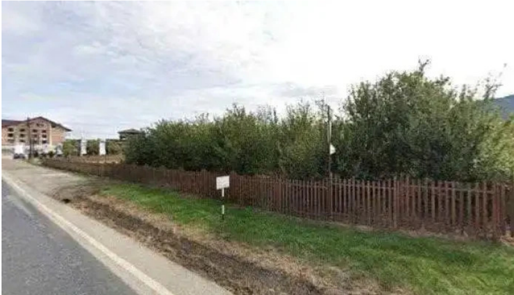
Muzeul de arheologie sarmizegetusa street view si 360deg