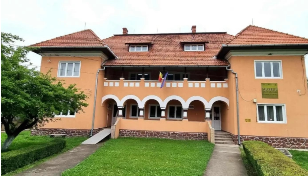
Muzeul de arheologie sarmizegetusa reduceri