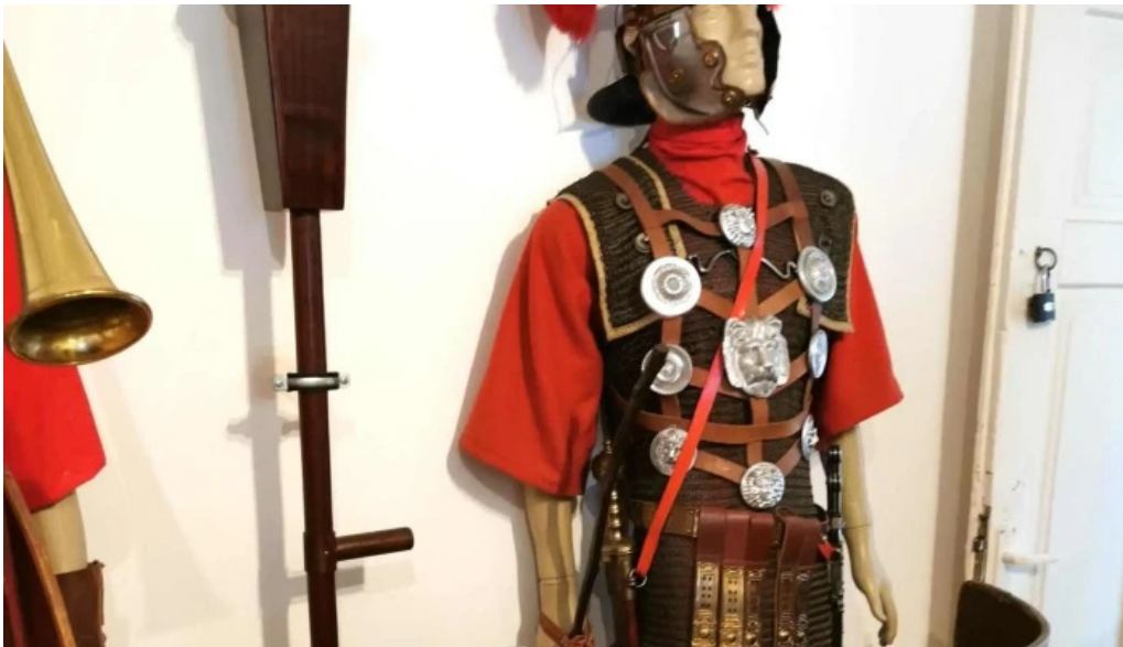
Muzeul de arheologie sarmizegetusa unde