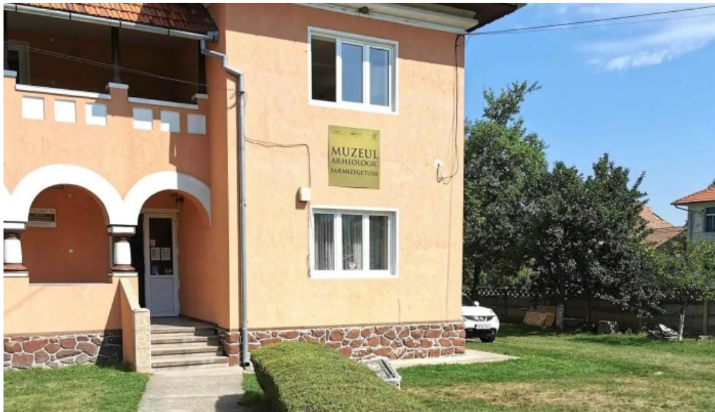
Muzeul de arheologie sarmizegetusa deschis acum