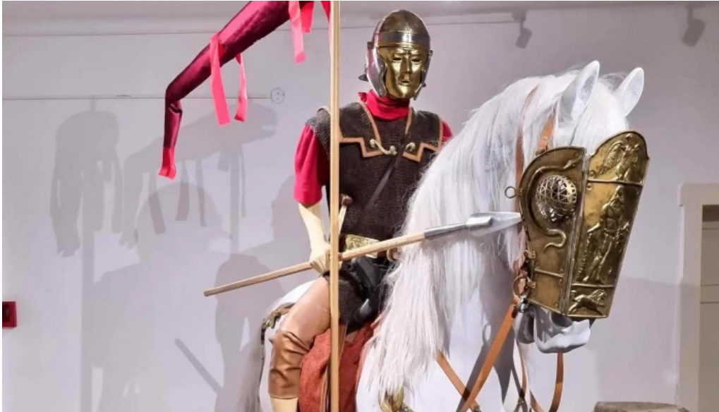
Muzeul de arheologie sarmizegetusa loca?ie