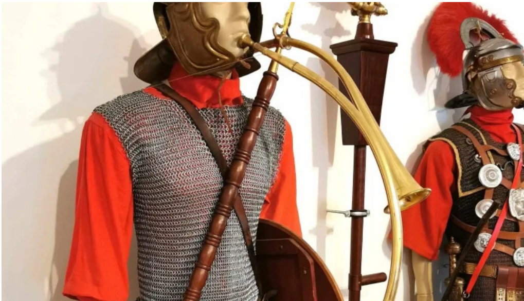
Muzeul de arheologie sarmizegetusa num?r