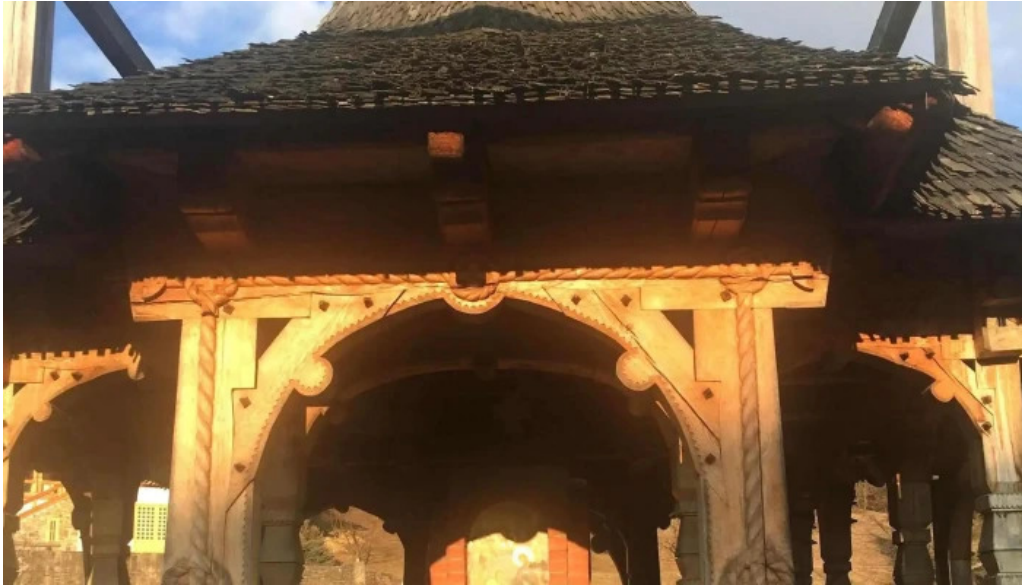
Manastirea barsana comentarii