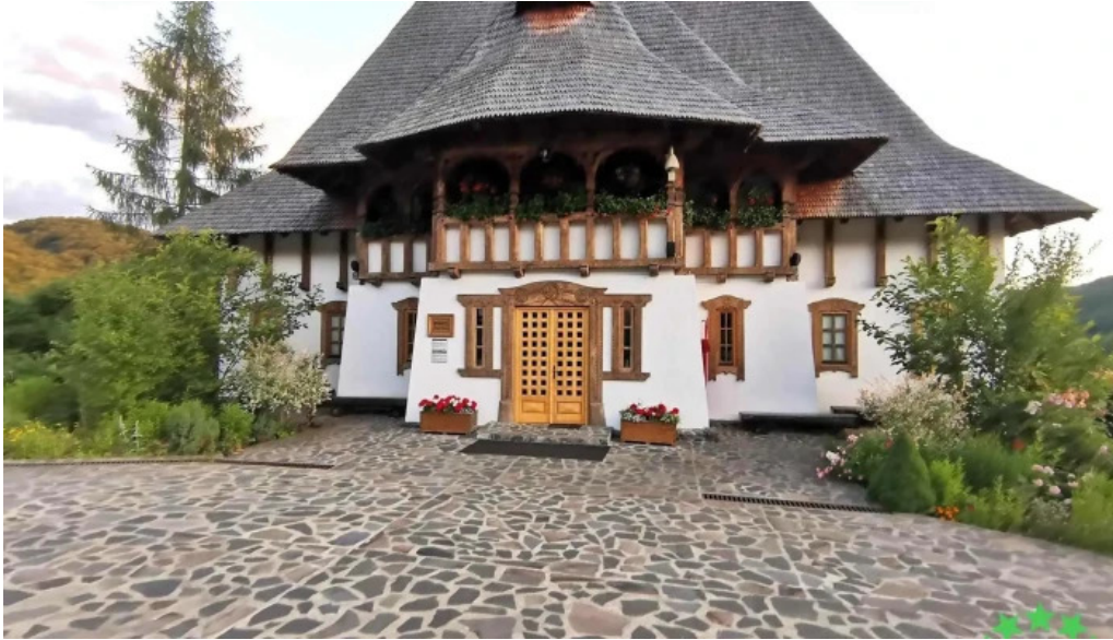
Manastirea barsana de la proprietar