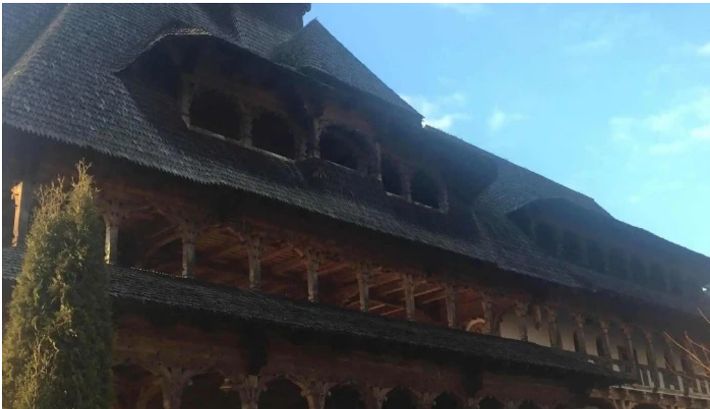
Manastirea barsana cum s? ajungi acolo