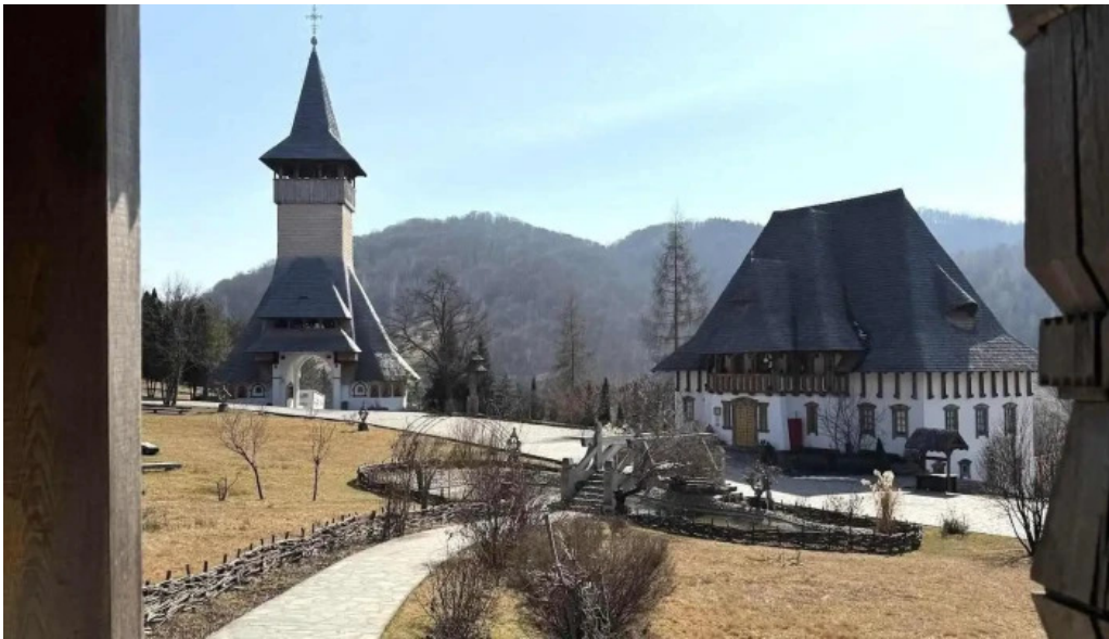
Manastirea barsana cele mai recente