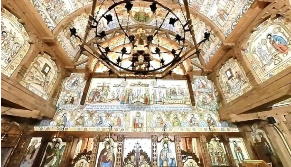
Manastirea barsana street view si 360deg