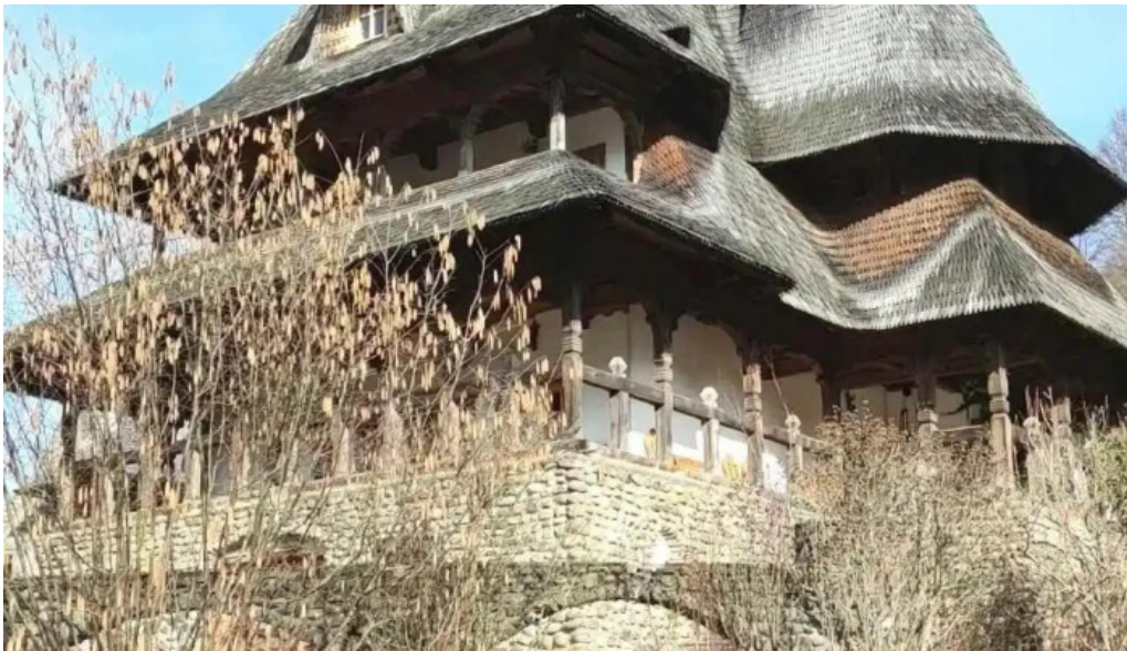
Manastirea barsana videoclipuri