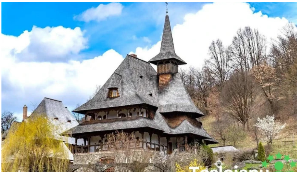
Măștiarea barsana barsana