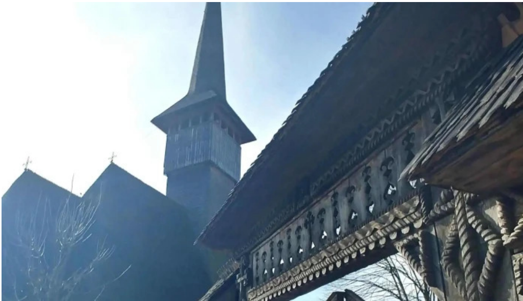
Manastirea barsana instagram