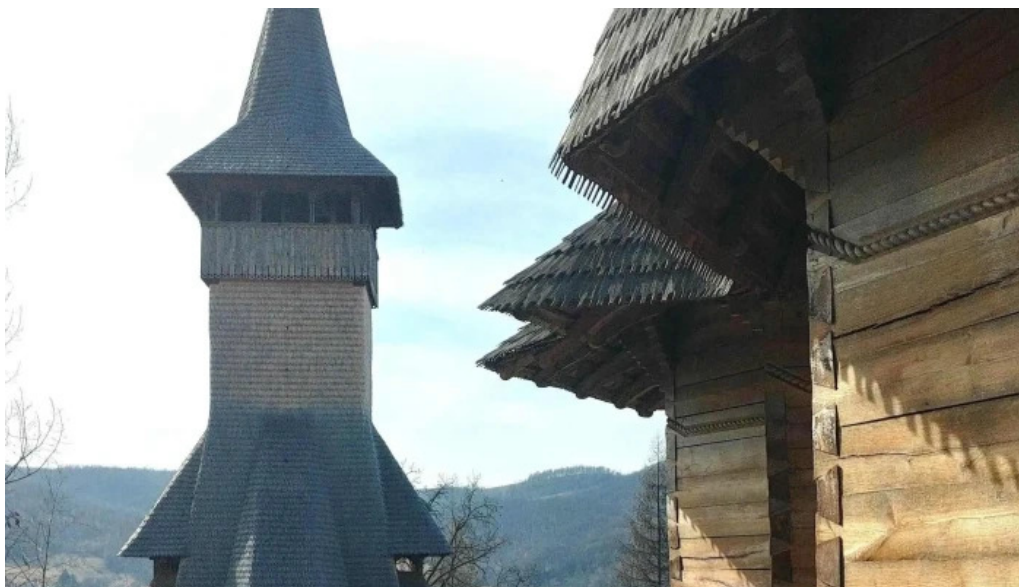
Manastirea barsana barsana