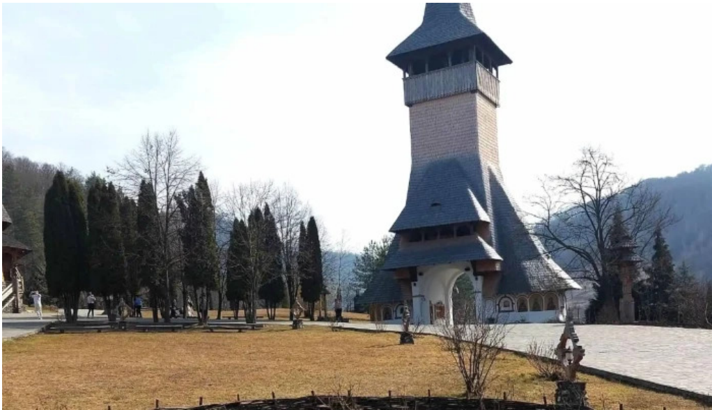
Manastirea barsana site web