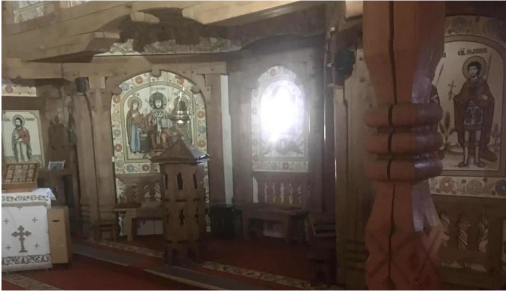
Manastirea barsana zon?