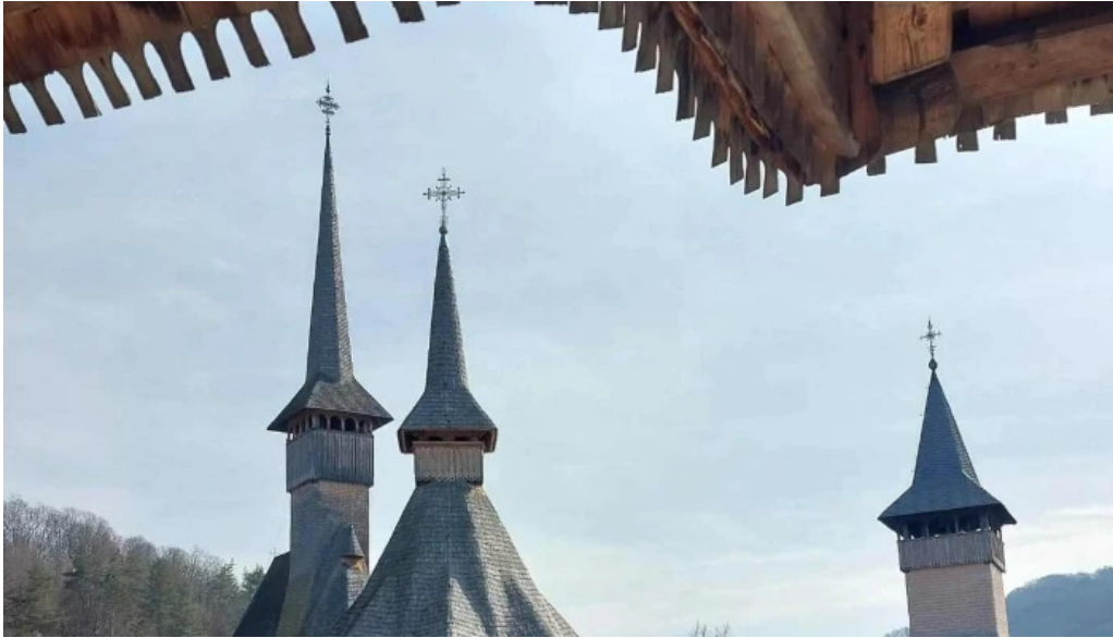
Manastirea barsana num?r