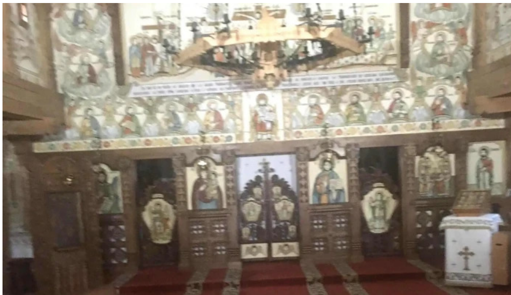
Manastirea barsana deschis acum