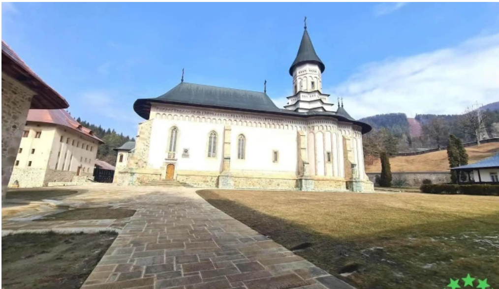
Manastirea ortodoxa bistrita cele mai recente