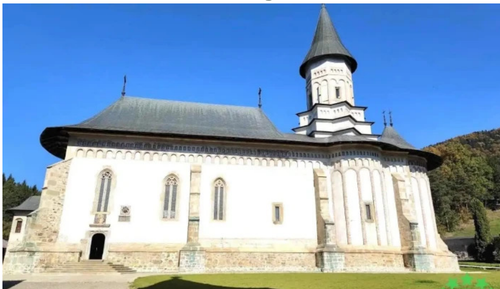
M?n?stirea ortodox? bistri?a bistri?a