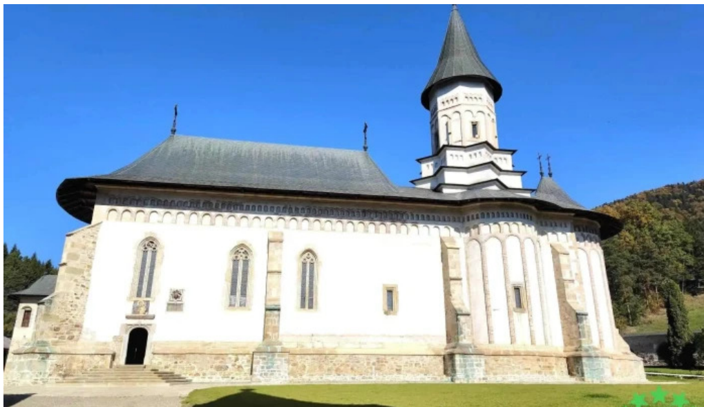
Manastirea ortodoxa bistrita site web