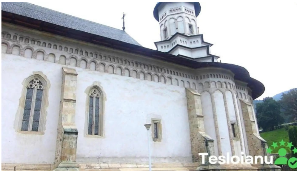
Manastirea ortodoxa bistrita videoclipuri