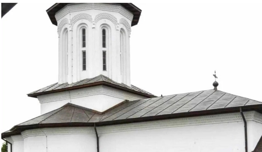
Manastirea brancoveni aproape de mine