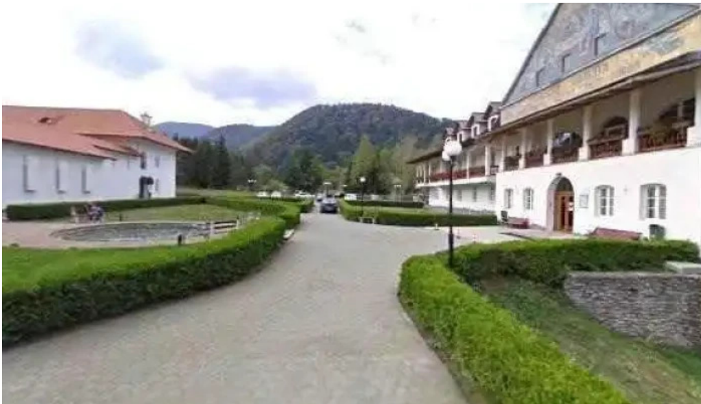
Manastirea brancoveni street view si 360deg