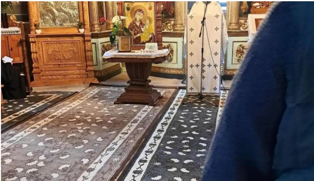
Manastirea brancoveni cele mai recente