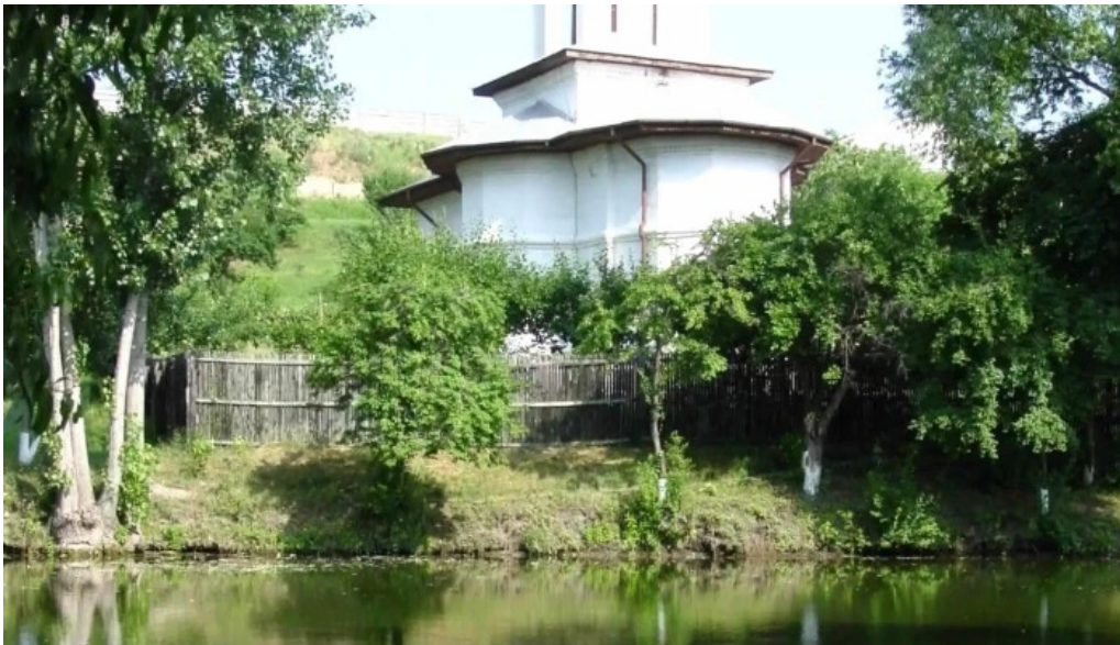
Manastirea brancoveni program