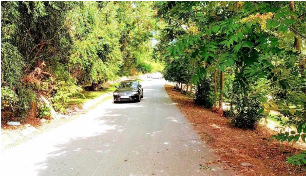
Manastirea brancoveni instagram