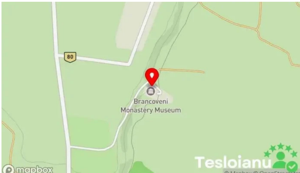
Manastirea brancoveni hart?