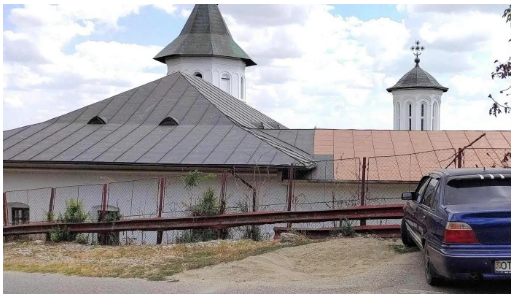
Manastirea brancoveni brancoveni