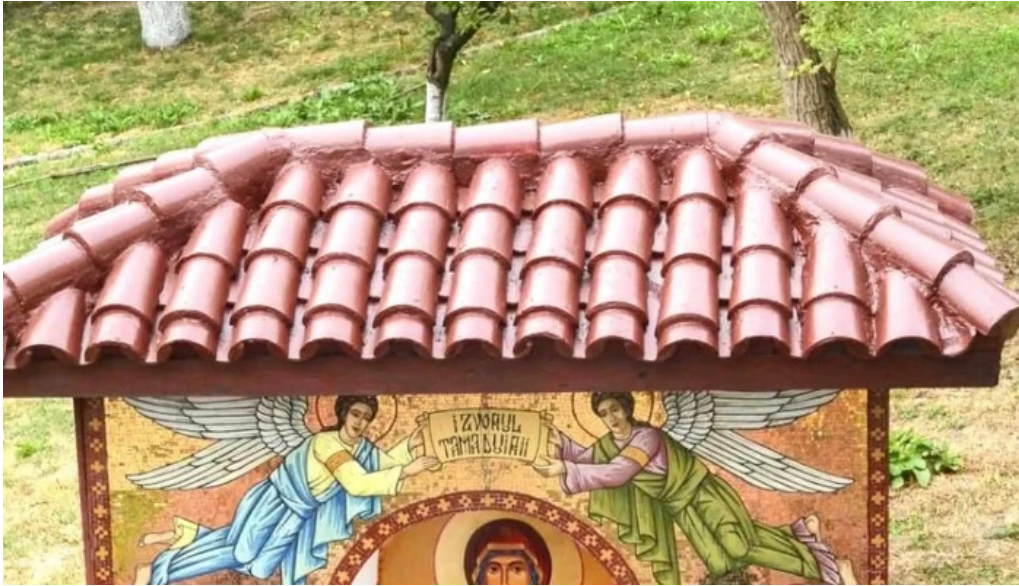
Manastirea brancoveni unde