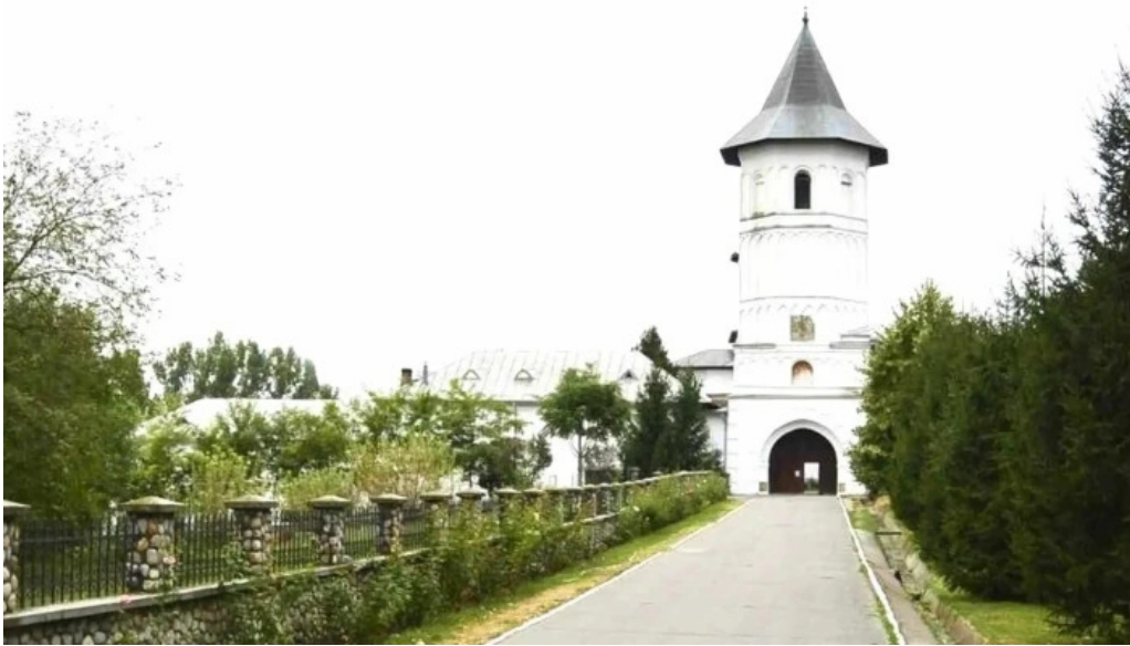
Manastirea brancoveni pre?uri