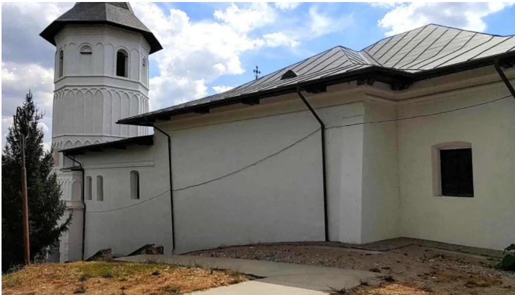
Manastirea brancoveni videoclipuri