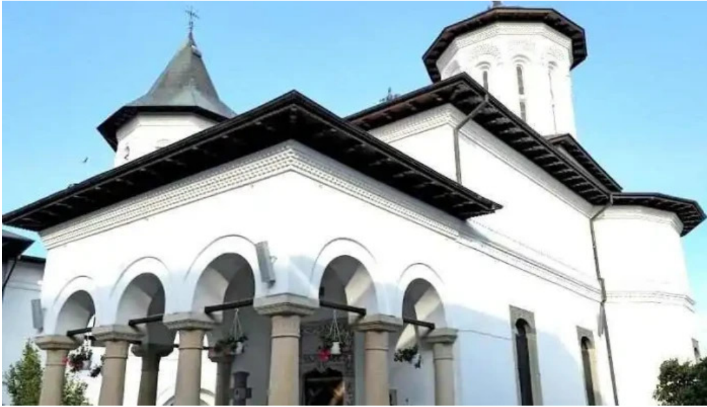
Manastirea brancoveni brancoveni