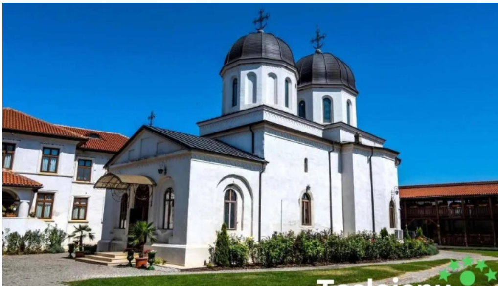
Măștiarea comana comana