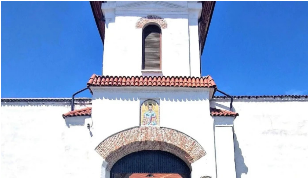
Manastirea comana program