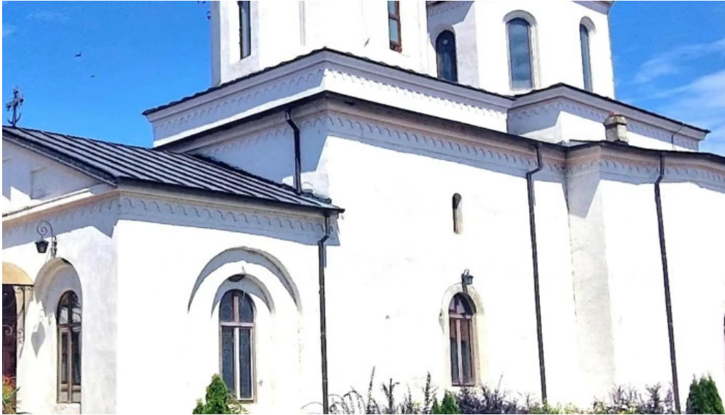
Manastirea comana recenzii