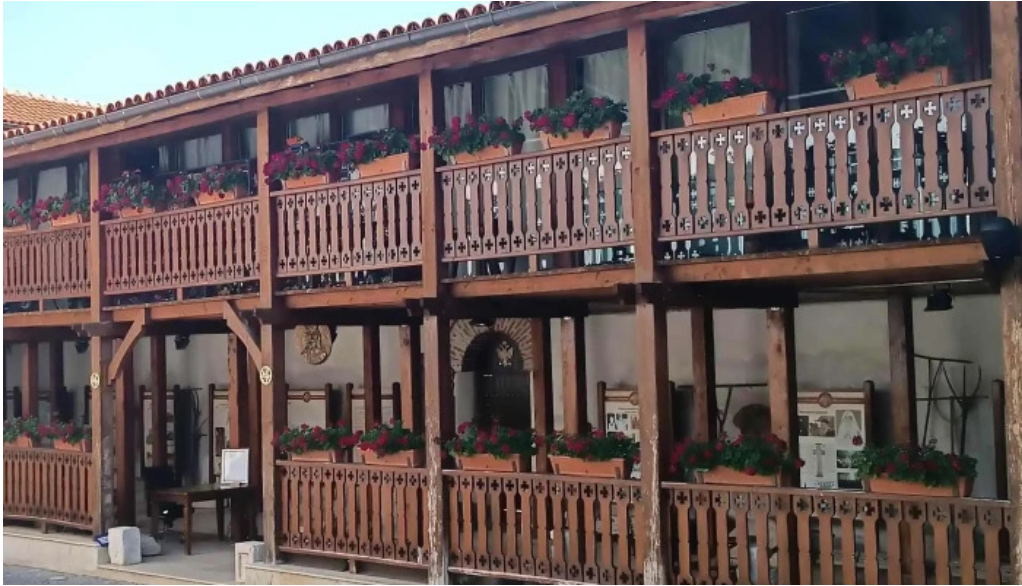
Manastirea comana fotografii