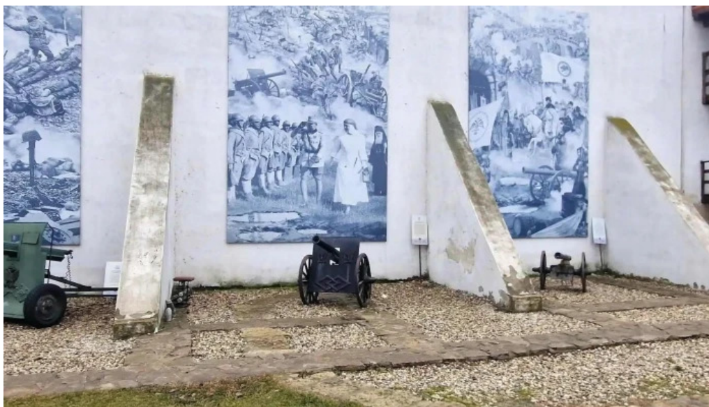
Manastirea comana adres?