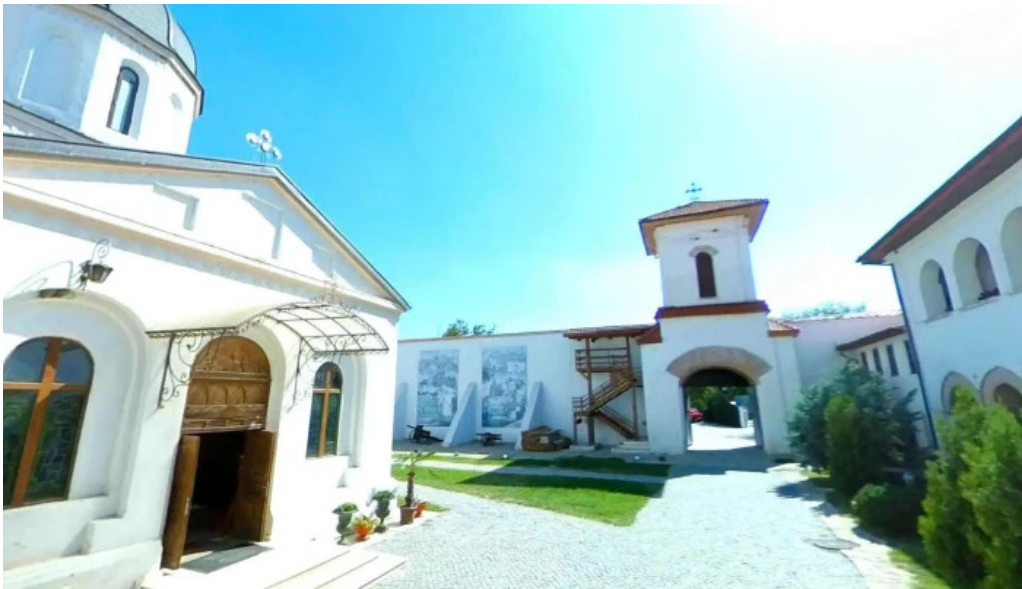
Manastirea comana street view si 360deg