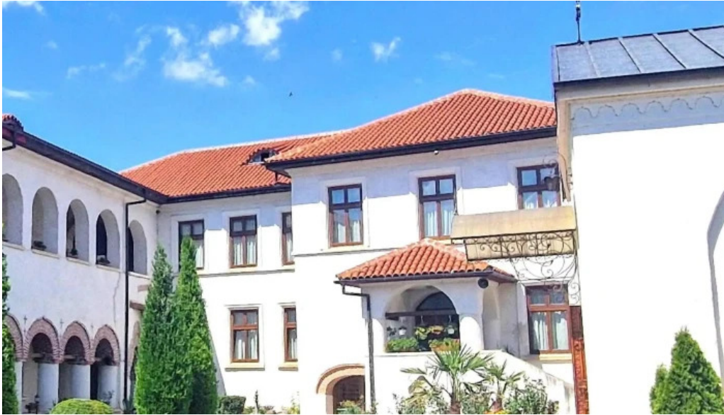
Manastirea comana telefon