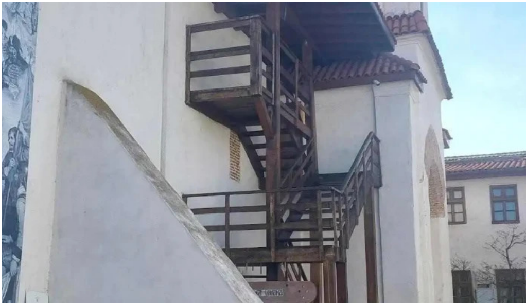
Manastirea comana cele mai recente