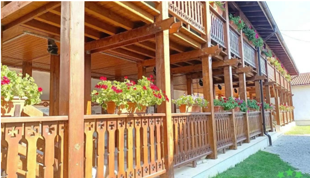
Manastirea comana muzeul manastirii comana