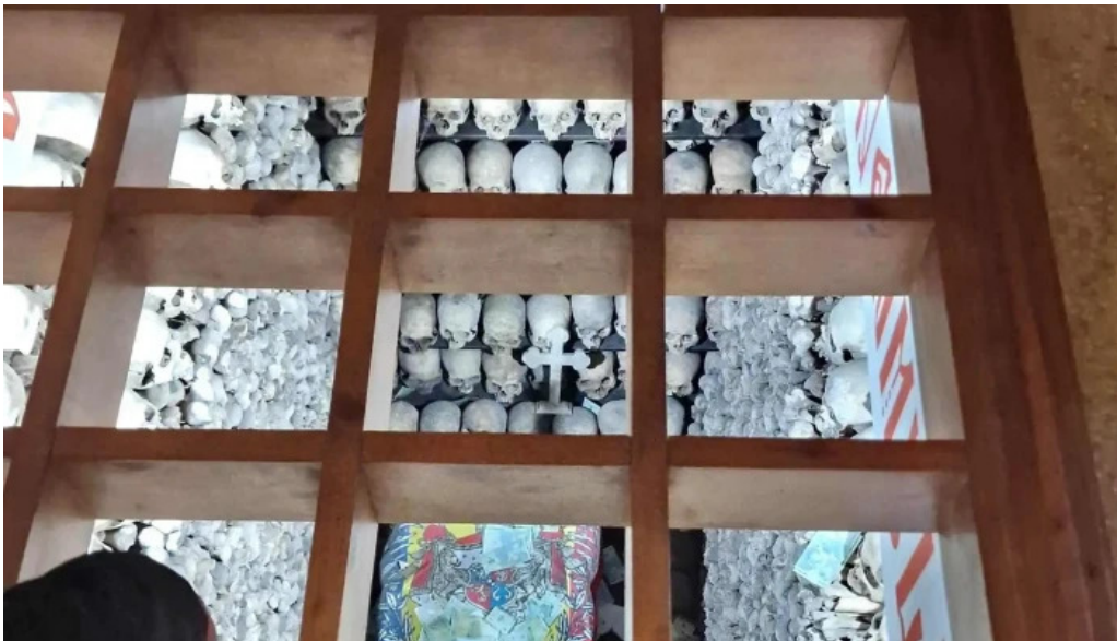
Manastirea comana deschis acum