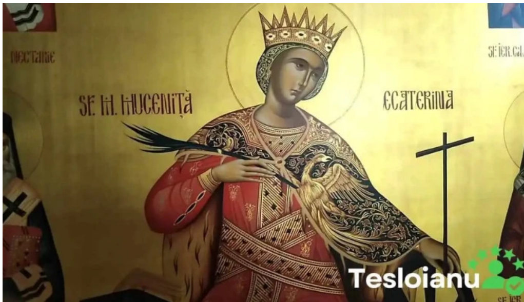
Manastirea comana videoclipuri