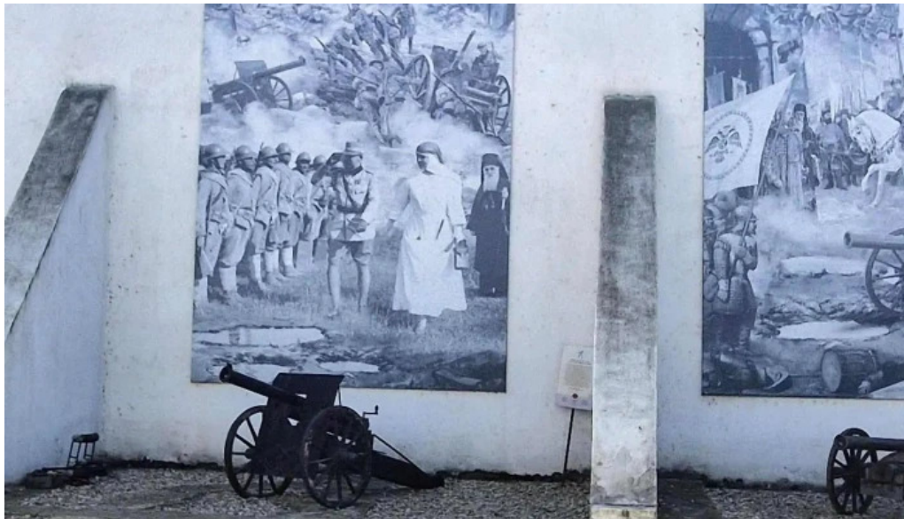
Manastirea comana zon?