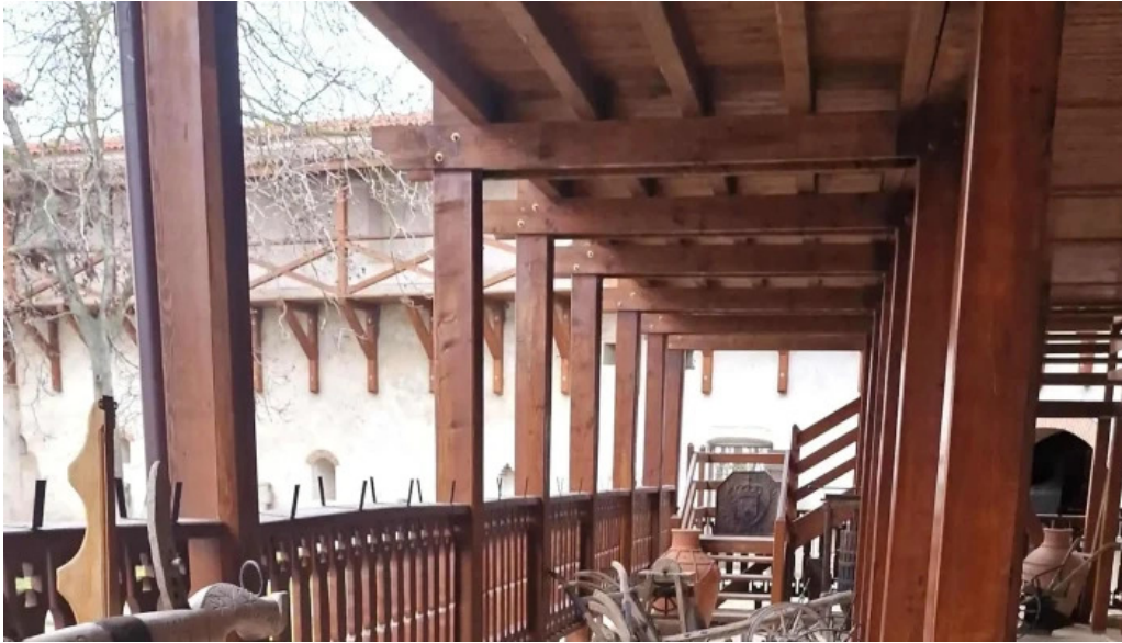
Manastirea comana comana