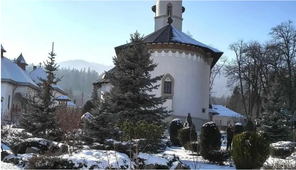
Manastirea varatec cele mai recente