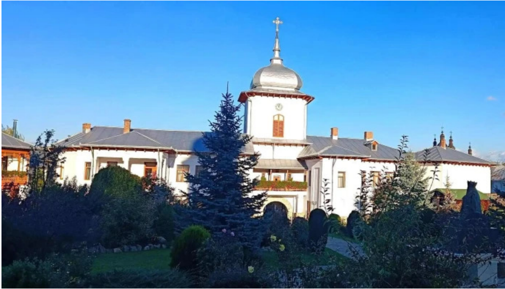
Manastirea varatec videoclipuri