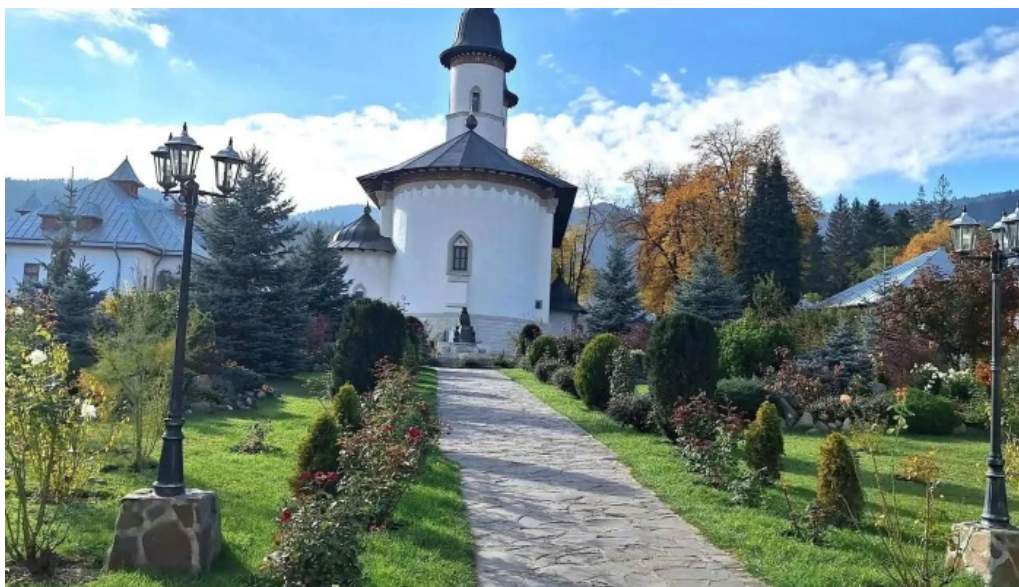
Manastirea varatec adres?