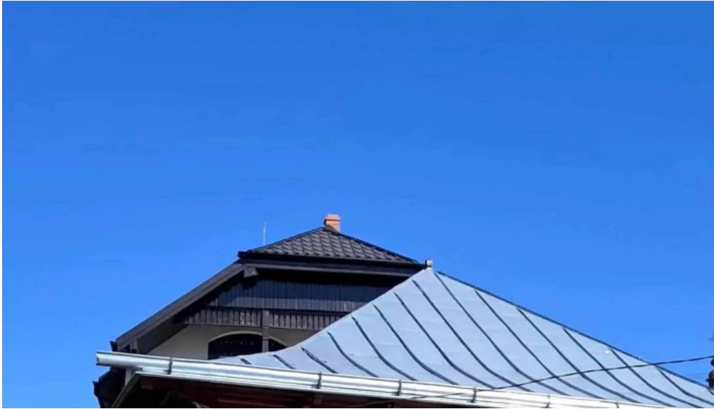
Manastirea varatec recenzii