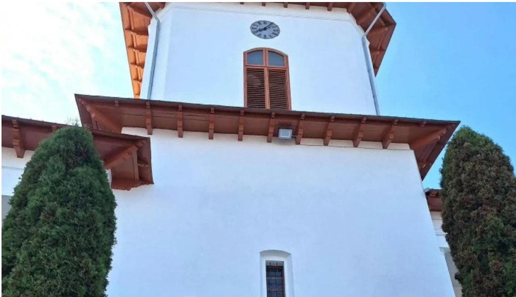
Manastirea varatec num?r