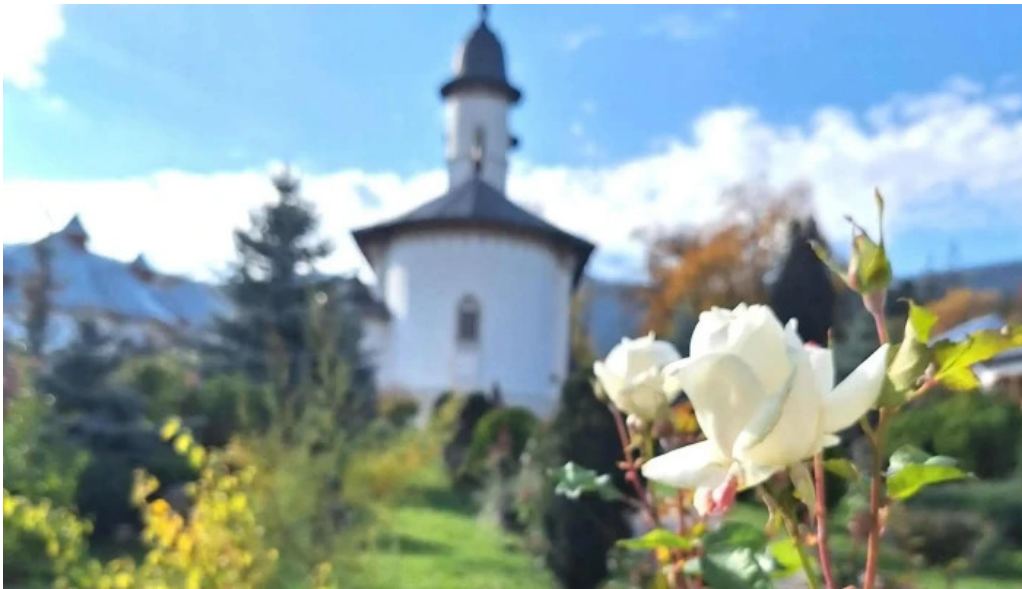
Manastirea varatec unde