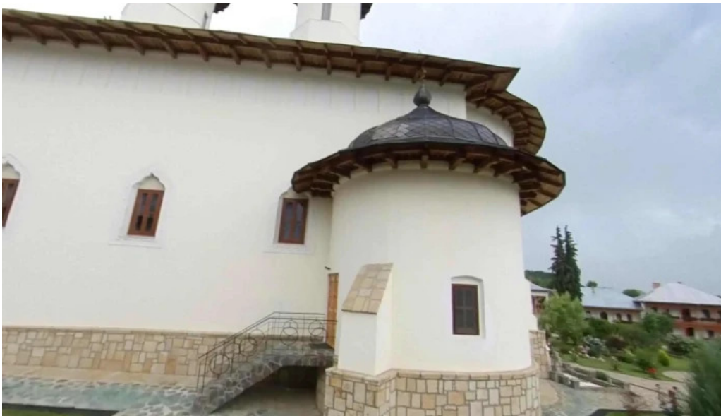
Manastirea varatec street view si 360