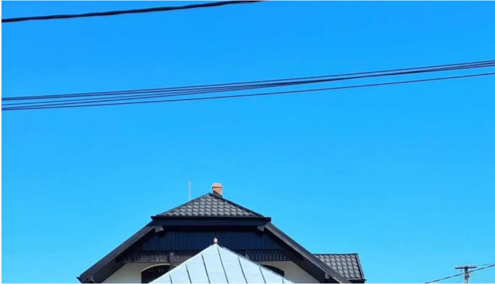
Manastirea varatec telefon