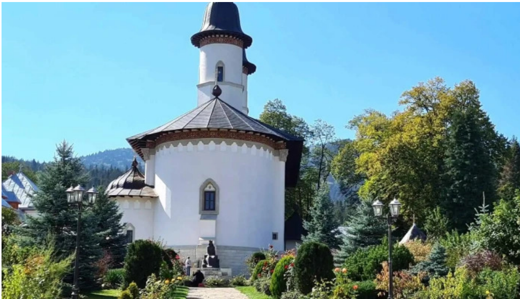
Manastirea varatec catalog