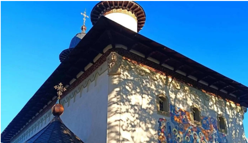
Manastirea varatec promo?ie