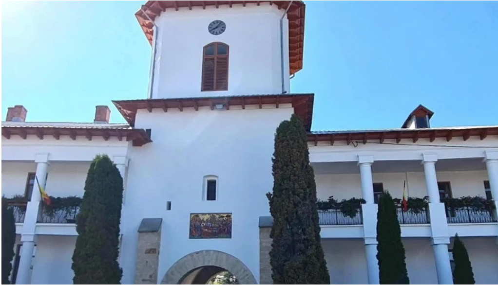
Manastirea varatec pre?uri