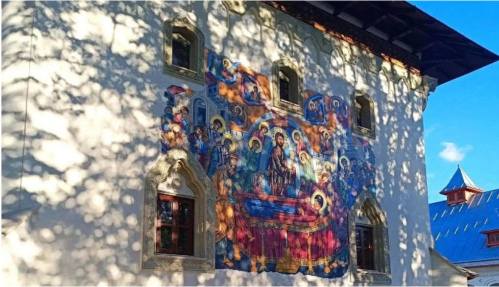
Manastirea varatec loca?ie