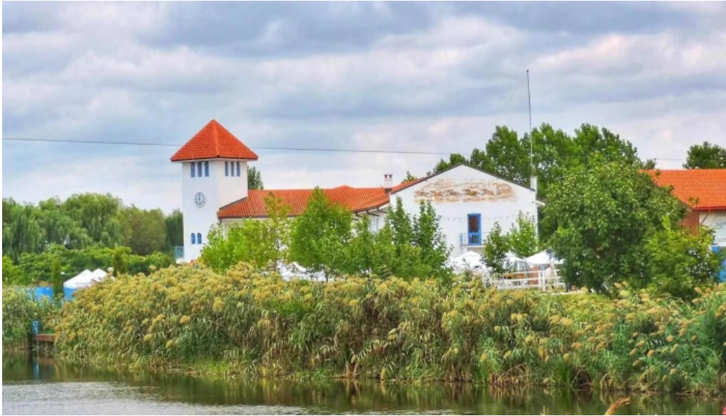
Parc comana program