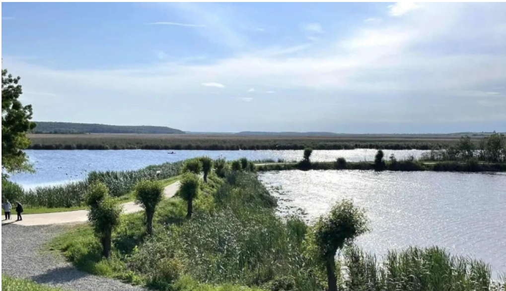
Parc comana fotografii