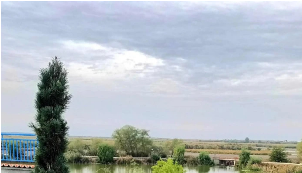
Parc comana unde