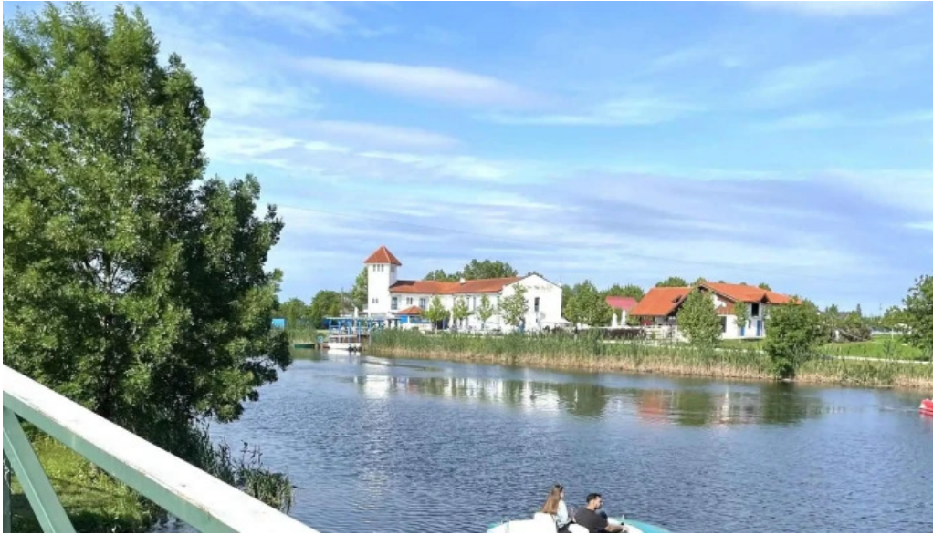
Parc comana comana