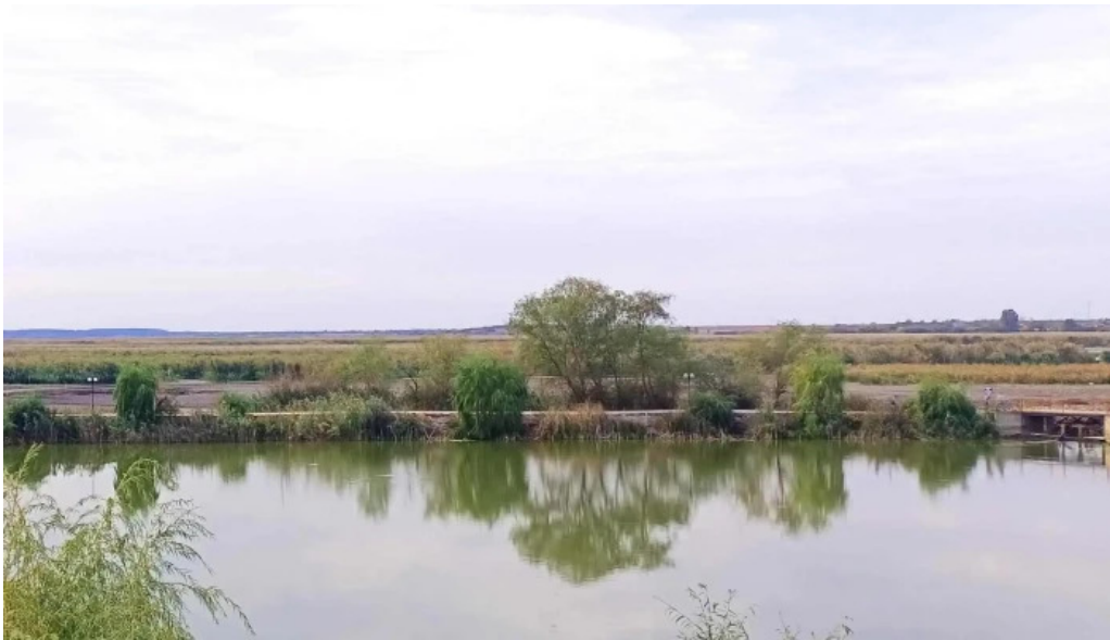
Parc comana instagram