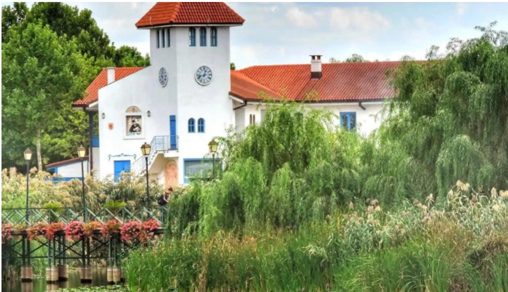
Parc comana site web