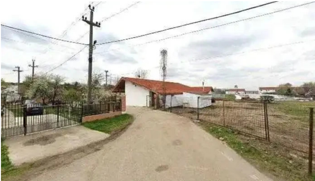
Parc comana street view si 360deg