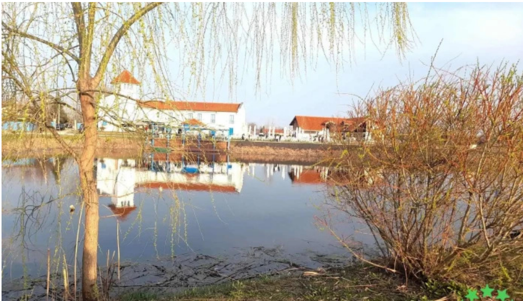
Parc comana cele mai recente