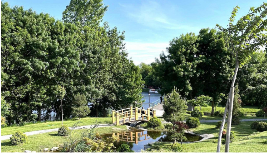
Parc comana videoclipuri