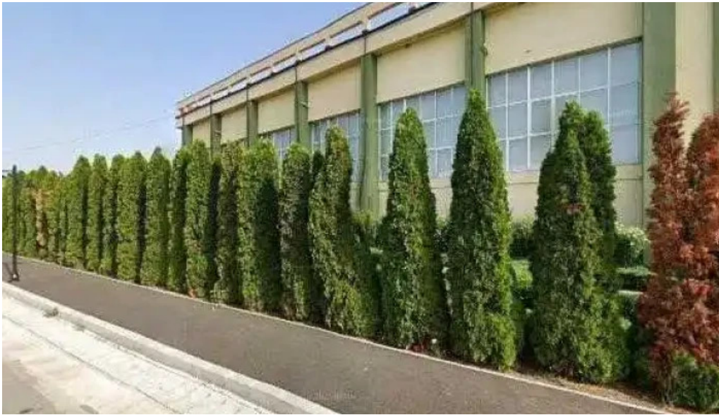
Parc brazi street view si 360deg