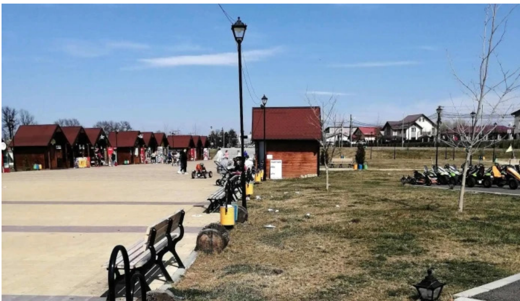
Parc brazi recenzii