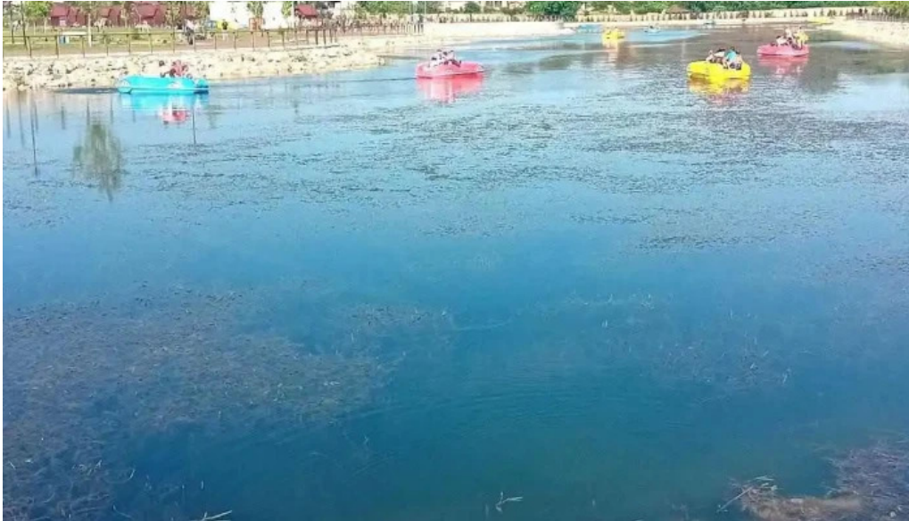
Parc brazii plaja