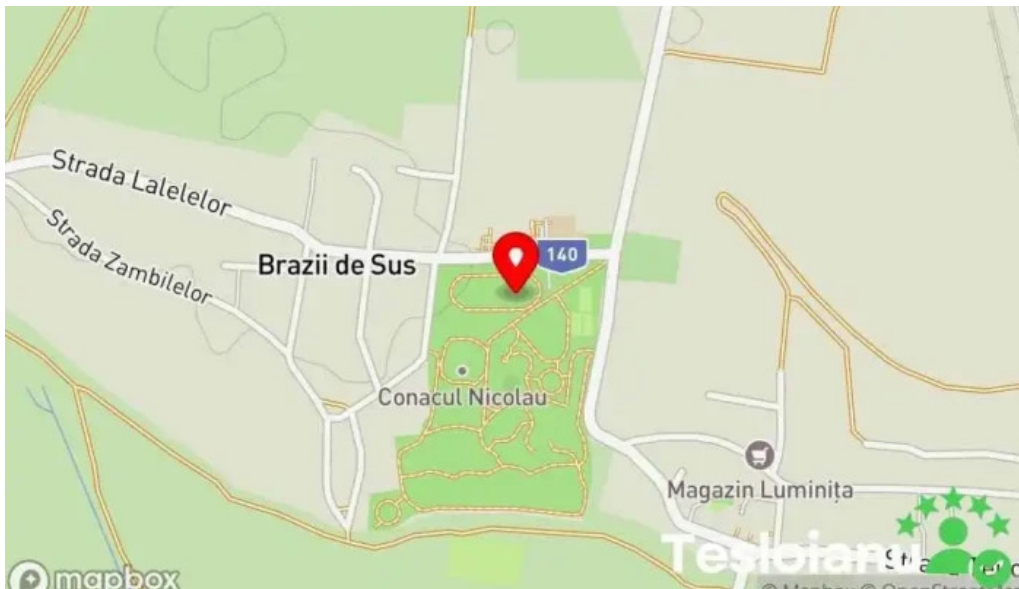
Parc brazii hart?