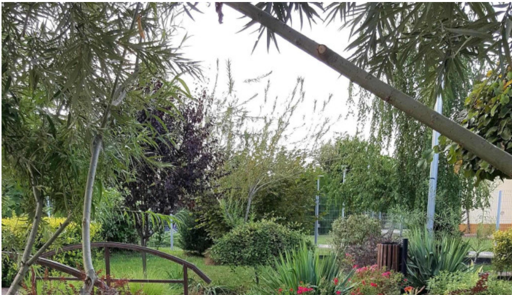
Parc brazi comentarii