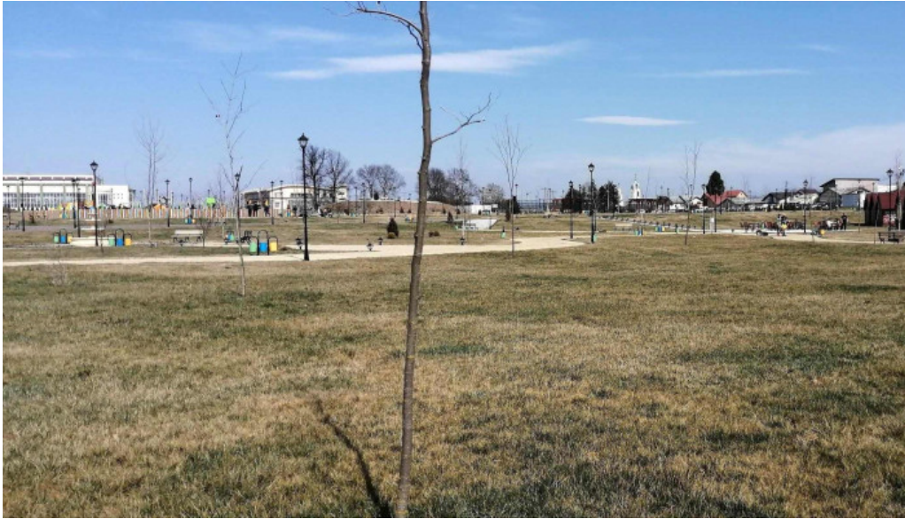
Parc brazi brazii de sus