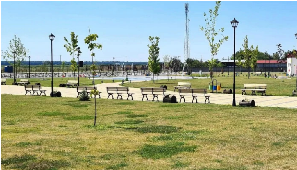
Parc brazi program