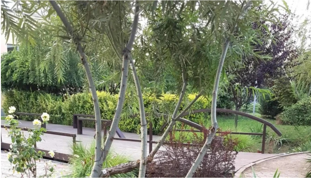
Parc brazi promo?ie