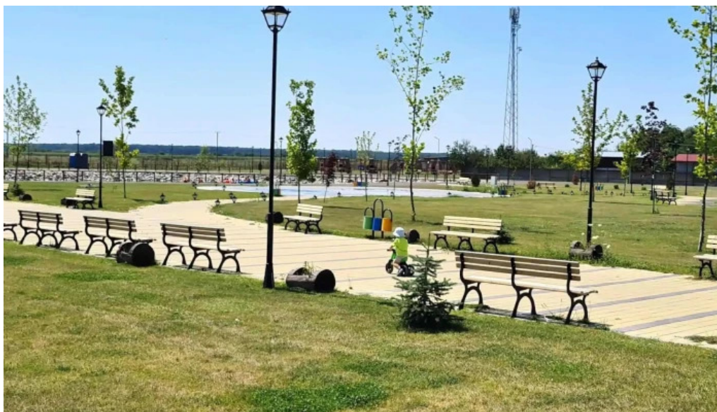
Parc brazii adres?