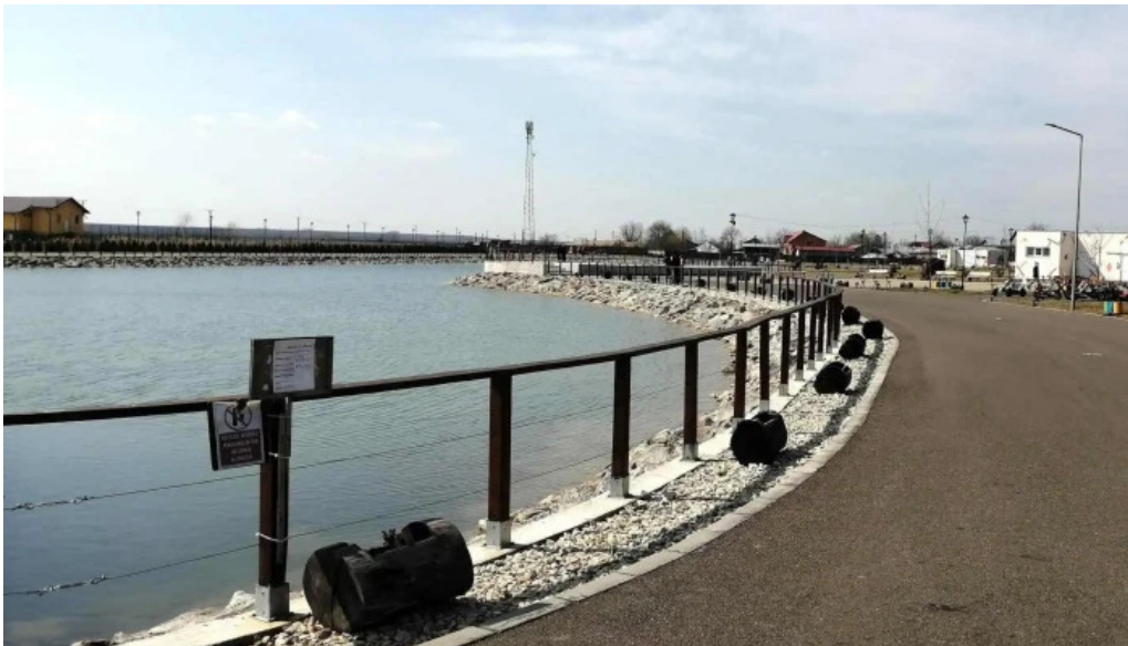
Parc brazi zon?