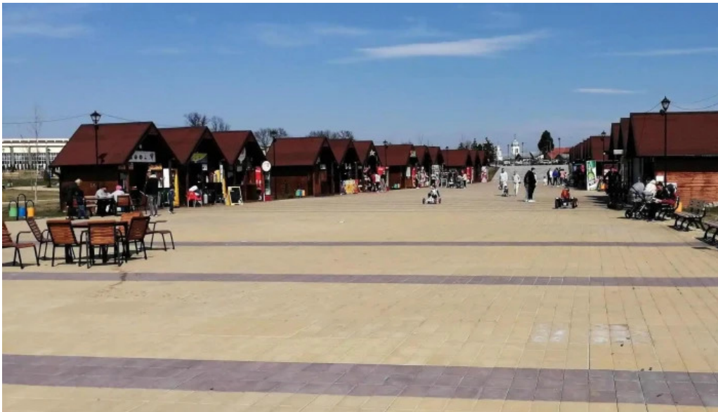
Parc brazi aproape de mine