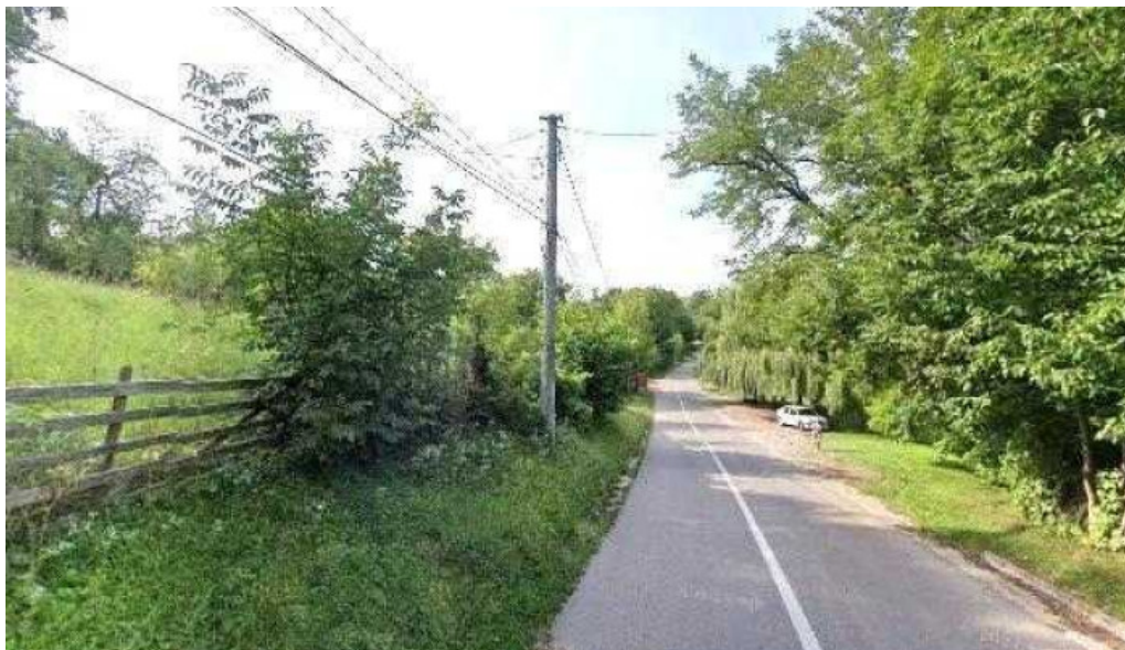
Parc brebu street view si 360deg