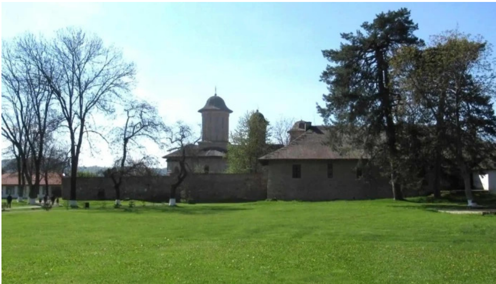
Parc brebu zon?