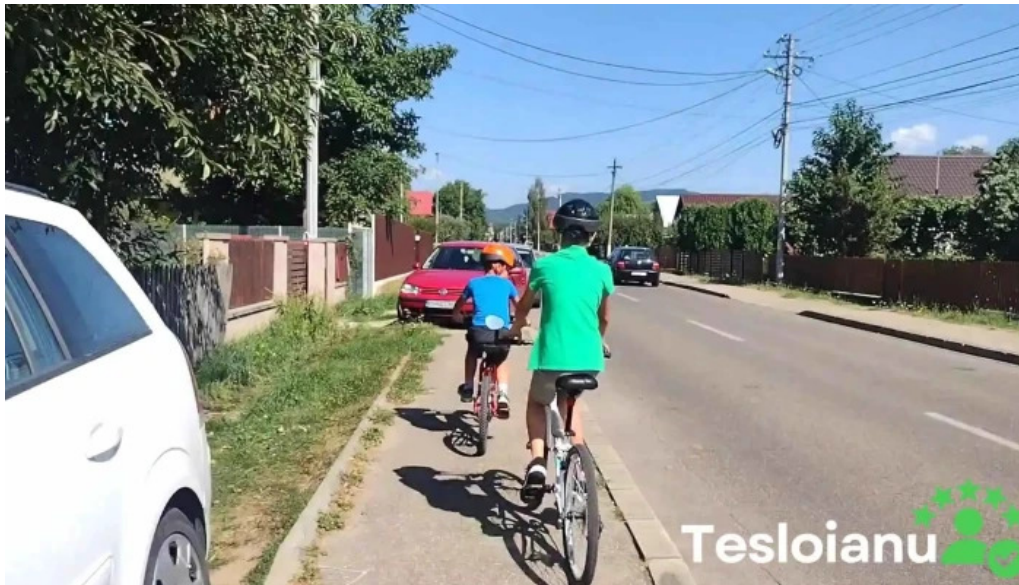
Parc brebu videoclipuri