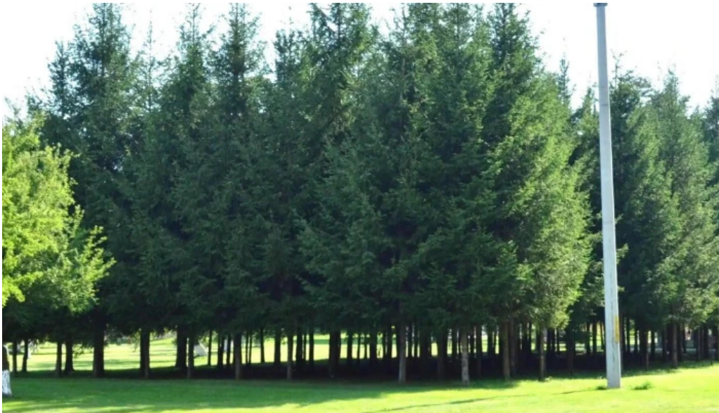
Parc brebu brebu m?n?stirii