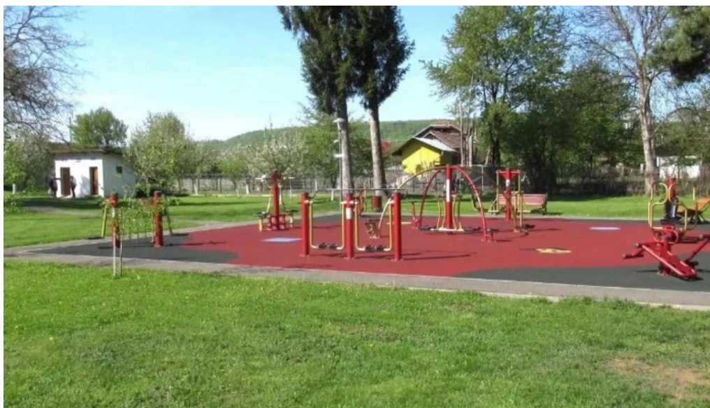
Parc brebu adres?