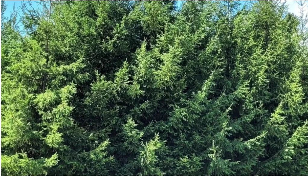
Parc brebu catalog