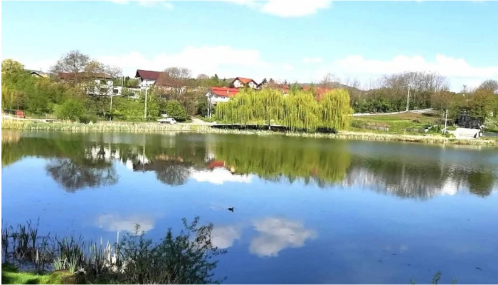
Parc brebu scor