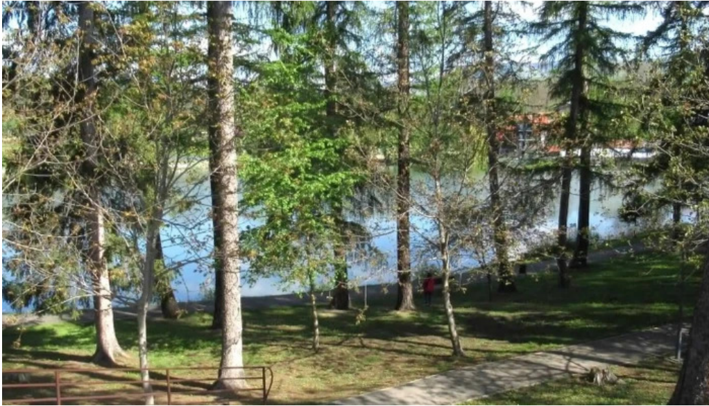
Parc brebu promo?ie