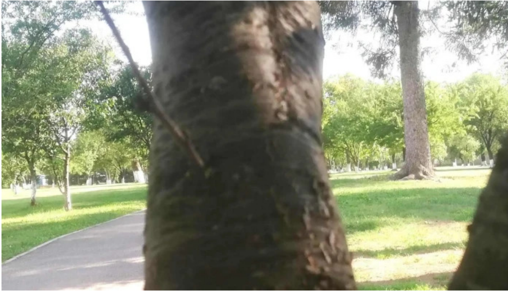
Parc brebu num?r