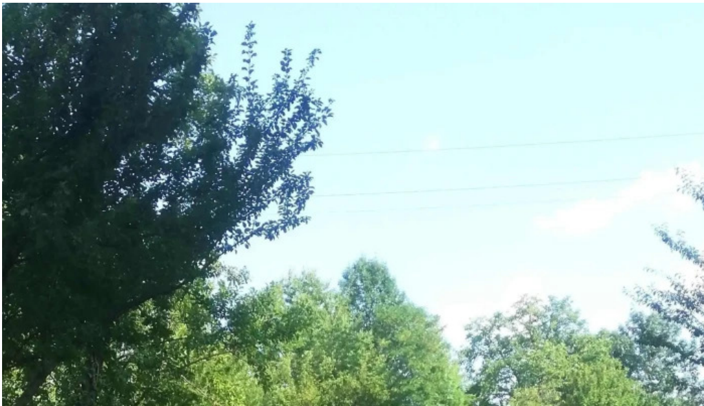
Parc brebu recenzii