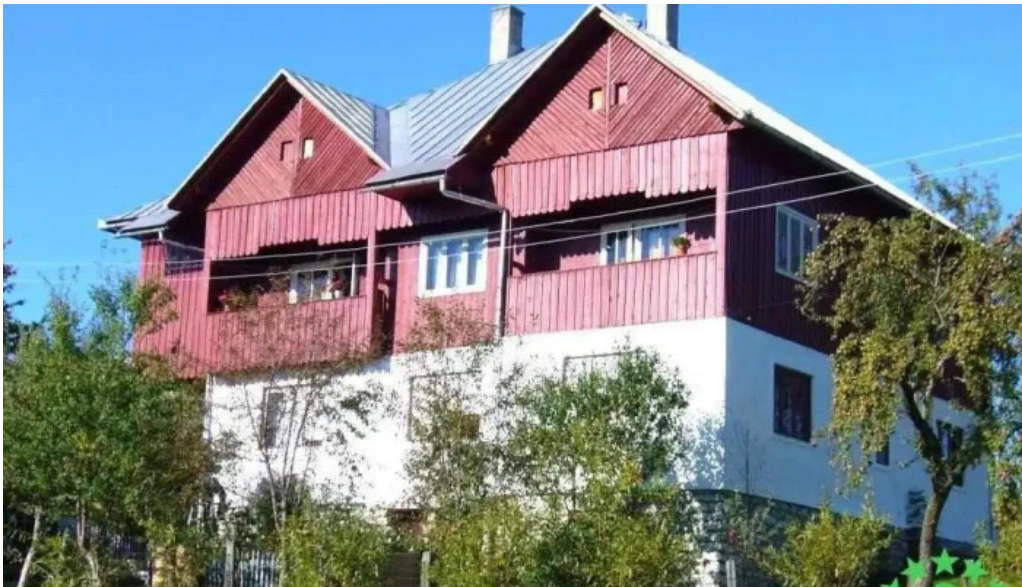
Pensiunea matis promo?ie