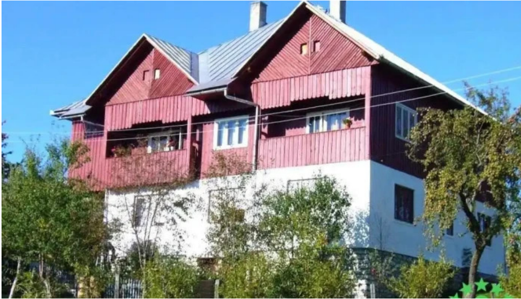
Pensiunea matis ra?ca