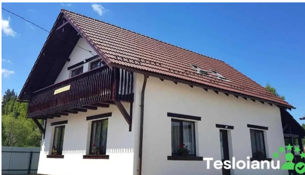
Pensiunea matis exterior