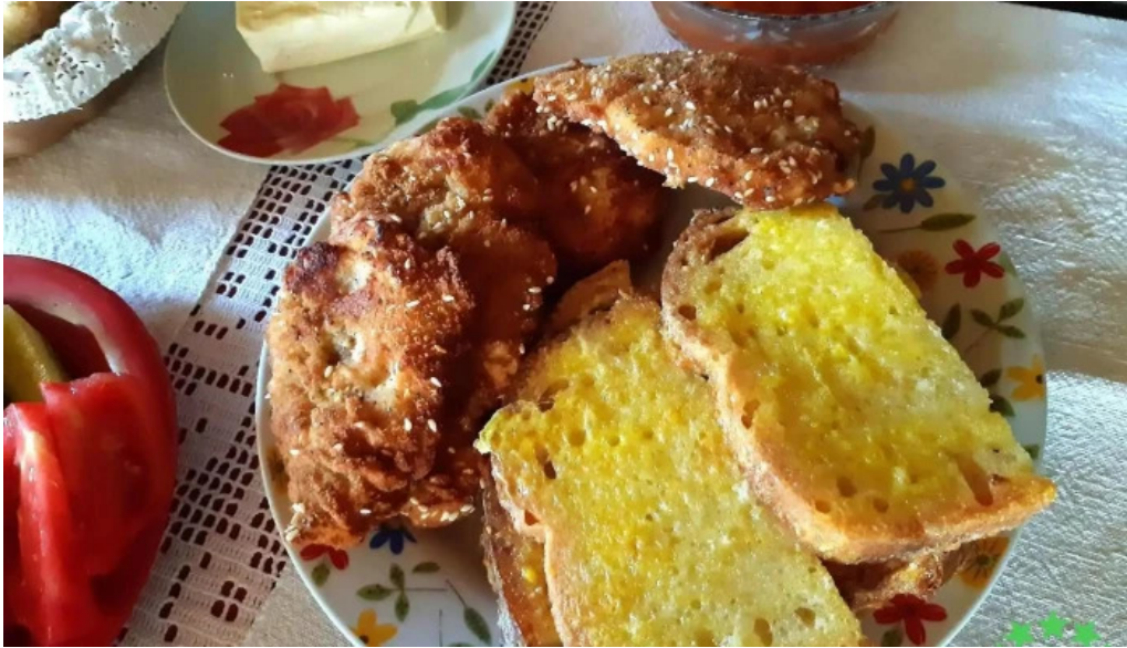
Pensiunea matis mancaruribauturi