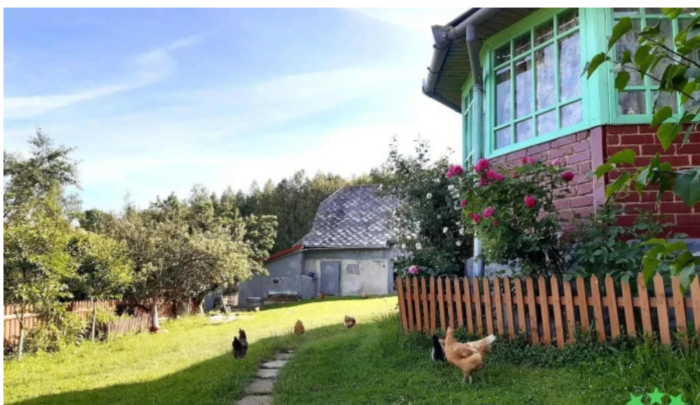
Pensiunea matis de la vizitatori