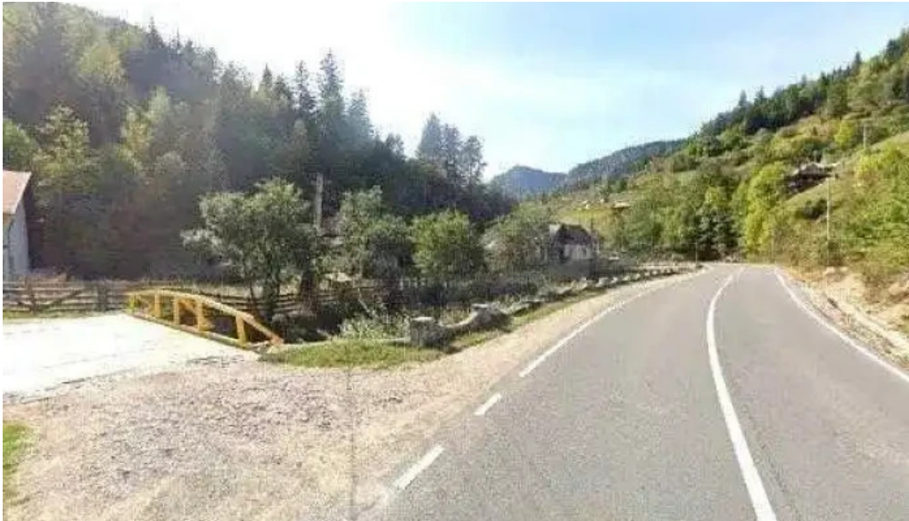
Pensiunea cheile sugaului street view si 360deg