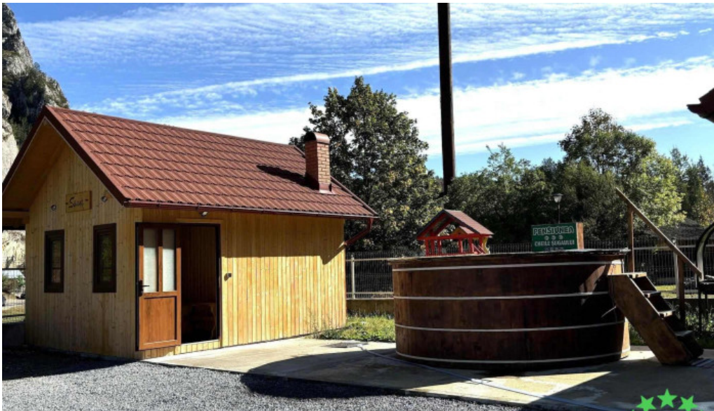
Pensiunea cheile sugaului de la vizitatori