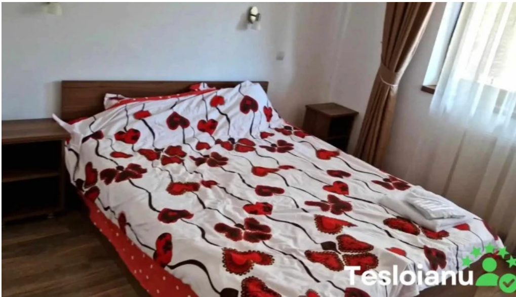
Pensiunea cheile sugaului videoclipuri