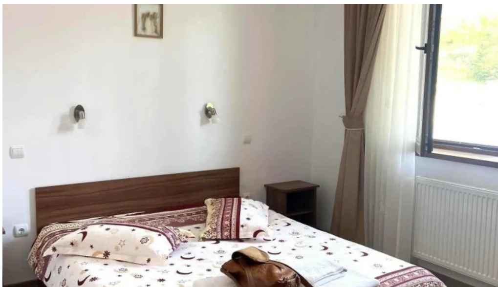
Pensiunea cheile sugaului camere