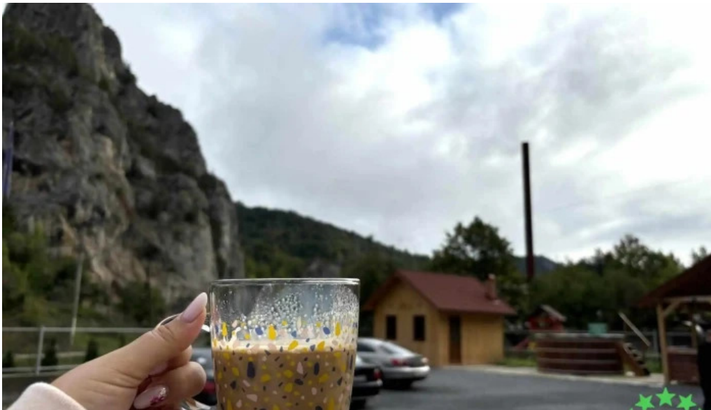
Pensiunea cheile sugaului mancaruribauturi