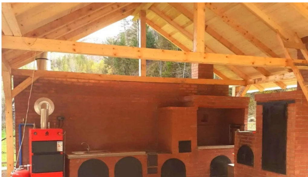
Pensiunea cheile sugaului de la proprietar