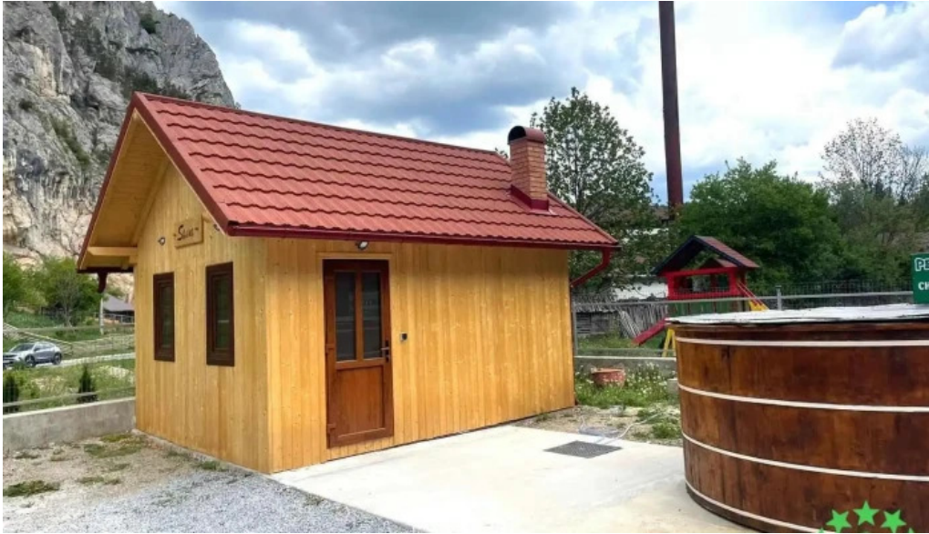
Pensiunea cheile sugaului telefon