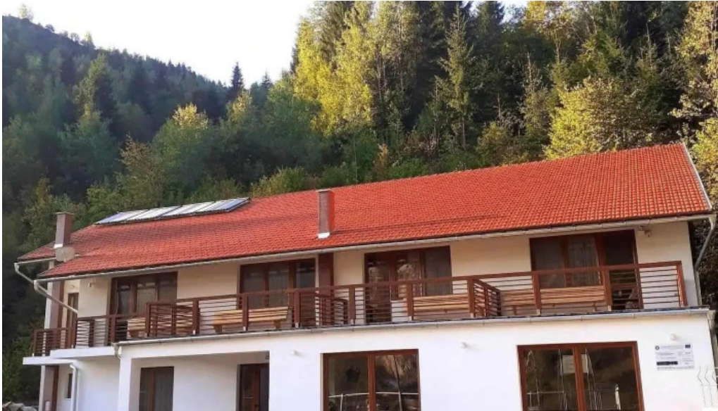
Pensiunea cheile sugaului exterior